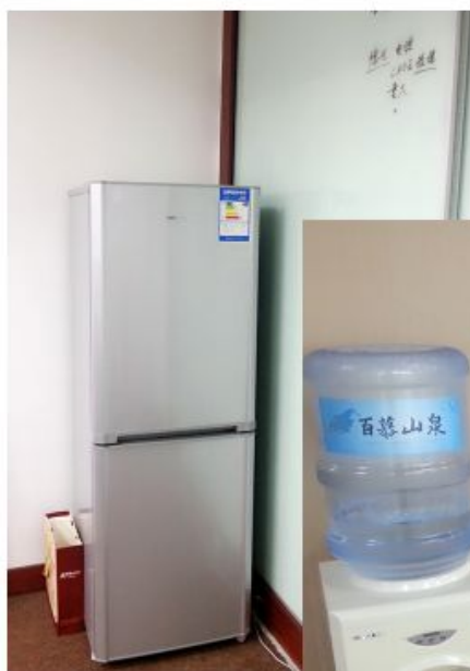
齐全周到的员工生活设备