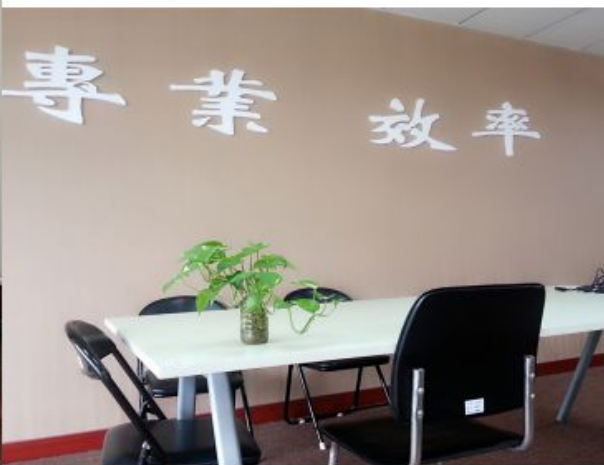
简约舒适的会议区域