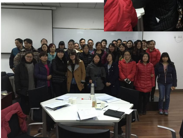
ISO9001 质量管理体系 昆山企业交流研讨会