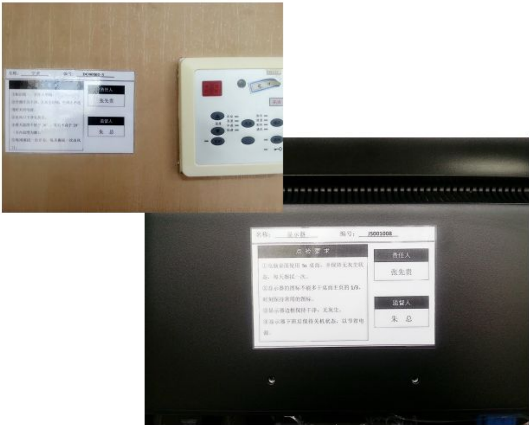
对办公区域开关及计算机设备进行节能管理