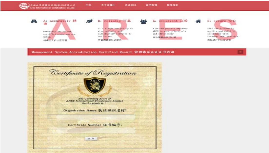
ARES 网站 证书查询服务界面

自 2015 年 2 月 12 日正式获得认监委批准设立，开展质量管理体系认证服务，ARES 根据自身审核员资源配置及公司技术领域现状，稳步开展认证业务，截至 2015 年底，共注册质量管理体系有效认证证书 205 张，并通过 ARES 官网向获证企业提供证书查询服务。2016 年，我机构也将强化也客户为本的社会责任，通过优质周到的认证及增值服务，做好获证客户的监督审核工作，维系客户稳定性，提高顾客满意度。