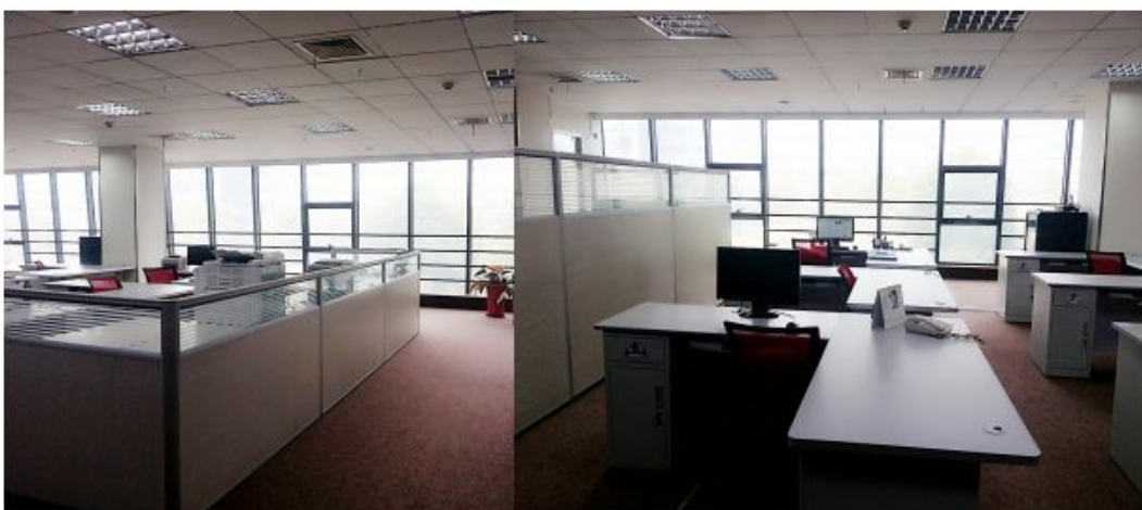
宽敞舒适的办公区

众所周知，搜索巨头谷歌无疑是世界上最成功的公司之一，在经营业绩力拔头筹的光环之下，人性化的办公环境，也使 Google 成为商界的典范，其轻松愉悦的环境氛围、面面俱到的人性化设施，另众多求职者、在职者对谷歌工作的员工羡慕不已，而一个舒适轻松的办公环境，也是拉近员工距离、建立员工良好的社交关系，更充分的调动员工工作热情，提高工作效率的源动力。