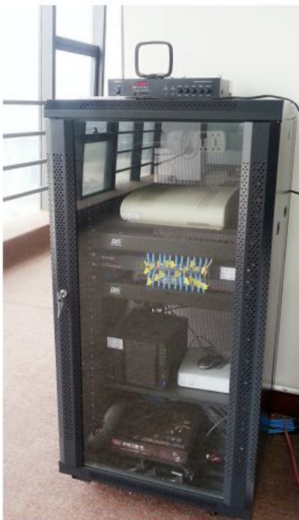
办公区音乐播放设备