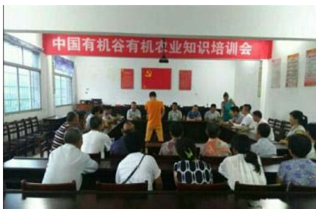
2015 年 12 月东方嘉禾在湖北保康县为当地企业免费培训有机农业技术知识和标准