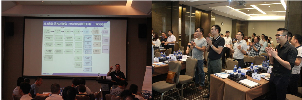
图为标准研讨现场

顾客满意 ——ABS QE 的客户满意调查覆盖率达100%，我们对每一次现场审核的审核人员表现均进行书面调查，2015年度没有出现客户表示不满意的情况。在此基础上，我们建立了客户意见登记反馈制度，及时接收、登记客户对公司日常管理工作中的意见、建议和投诉，并及时进行了反馈。截至12月底，共收到20条建议和意见，反馈后的客户满意度达100%。