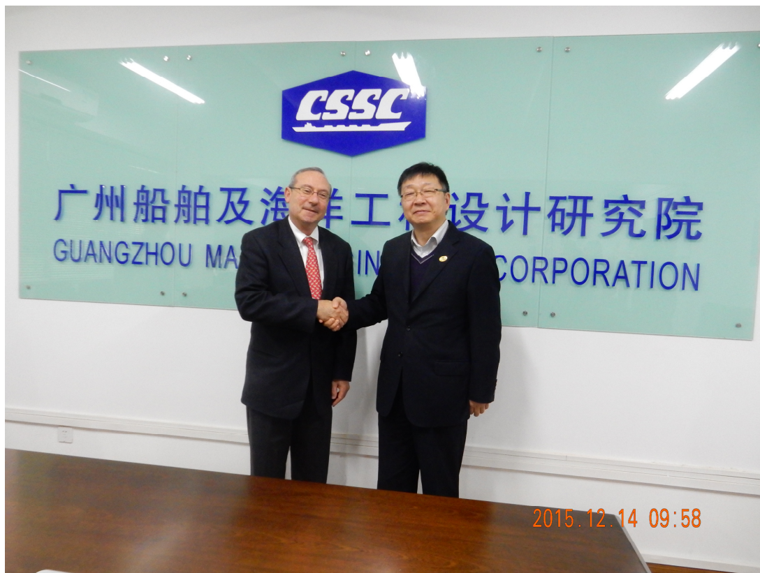
图为广州船舶及海洋工程设计研究院回见ABS QE总裁Alex Weisselburg先生

认证结果被各方广泛采信，我们在船舶与海洋工程建造行业领域的质量、环境和职业健康安全认证证书在投标过程中成为认证客户管理水平的佐证。我们在美标产品企业中进行体系认证，得到广泛行业采信和欧美客户认可。