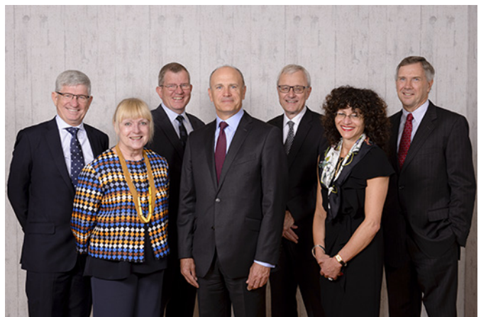
SAI GLOBAL - 我们的管理层

SAI Global 认证委员会的主要职责就是确保 SAI Global 所主张的认证决议的独立性与完整性的可信度，确保公司拥有合适的颁发、更新或暂停认证标志许可的程序，对 SAI Global 以及 SAI Global 认证服务的政策和操作程序进行考核，以确保符合鉴定要求以及认证决议的连贯性和系统性。