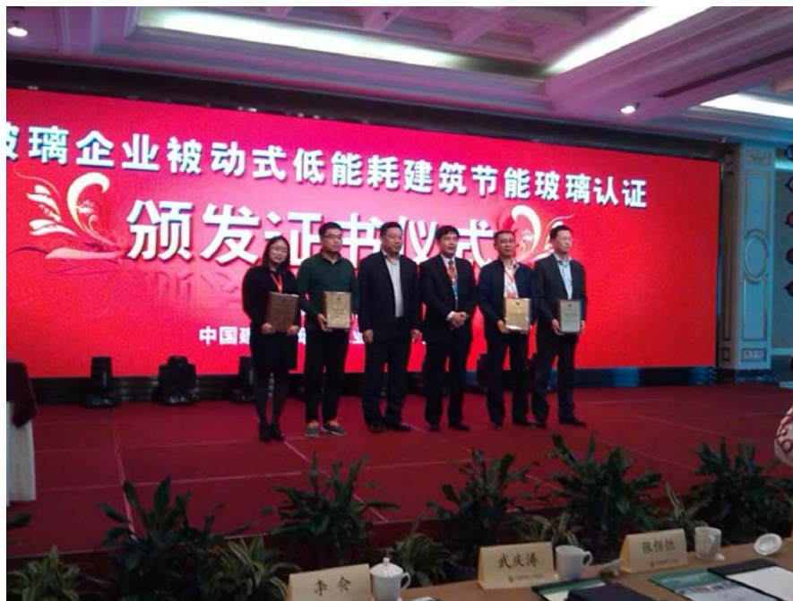
首批中空玻璃产品认证证书颁发仪式