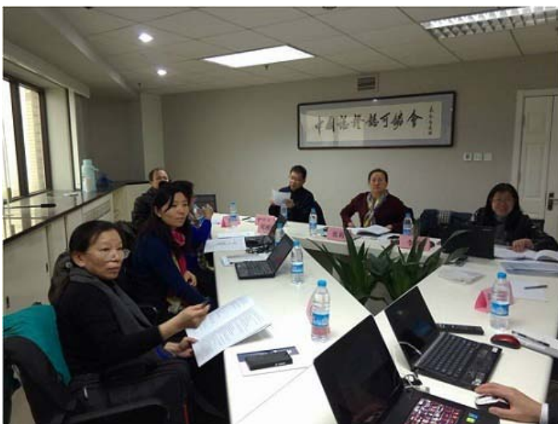
《能源管理体系 建材企业（不含水泥、玻璃、陶瓷企业）认证要求》标准审查会

2013-2014 年，我机构先后完成了国家认监委《能源管理体系 水泥企业认证要求》(RB/T 106-2013)、《能源管理体系 玻璃企业认证要求》(RB/T 111-2014)和《能源管理体系 建筑卫生陶瓷企业认证要求》(RB/T 110-2014)等标准的起草工作。2015 年，我机构承担了国家认监委《能源管理体系 建材企业（不含水泥、玻璃、陶瓷企业）认证要求》标准的起草工作，目前，该标准已通过标准审定委员会审查，正式报送国家认监委。上述四个标准同属能源管理体系认证系列标准，是 GB/T 23331-2012《能源管理体系 要求》在建材企业的具体要求。制定该标准的目的是为了规范建材企业能源管理过程，协助企业建立一套系统、科学且具有可操作性的能源管理体系，实施持续改进，实现能源目标，提高能源绩效，促进节能减排工作目标的实现。