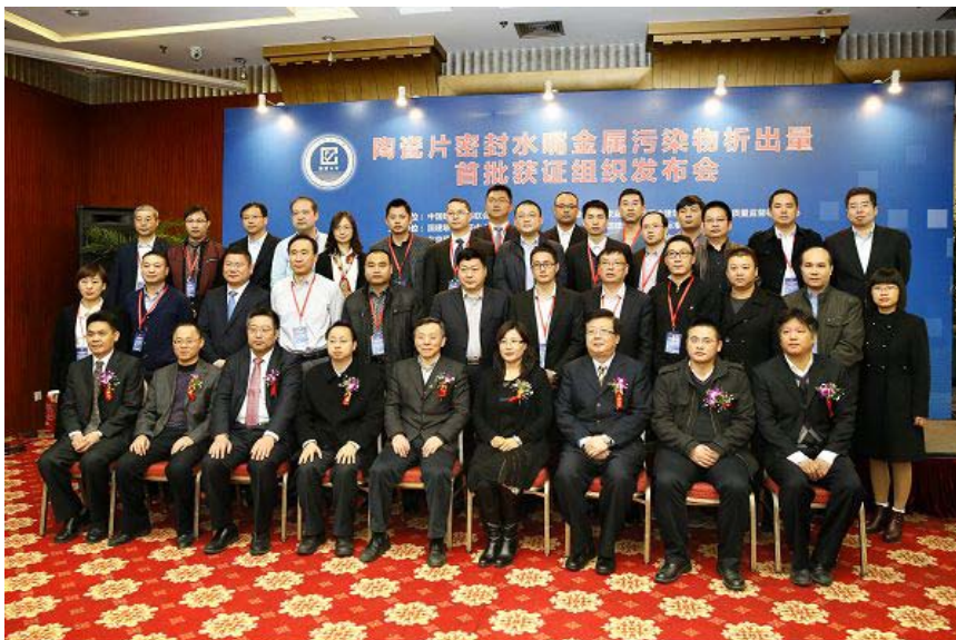
与会领导和获证组织代表合影

密封水嘴金属污染物析出量首批获证组织发布会。该项工作是加强建材行业标准化和质量管理工作的重要举措，不仅能够使水嘴金属污染物析出得到有效监控，更重要的是使生产企业进一步关注在生产工艺、关键原材料使用、金属污染物析出检测等过程建立质量保证体系，是规范企业生产行为自律的保证，也是向消费者提供公共信息的需要。该项工作也是为了推动 GB18145-2014《陶瓷片密封水嘴》标准的实施。