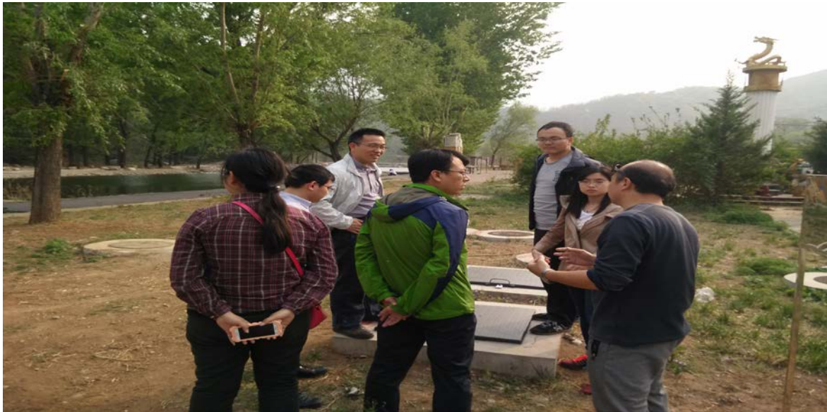
和中科院、清华大学博士后站及清华大学老师和北京雁栖河水环境示范研究现场