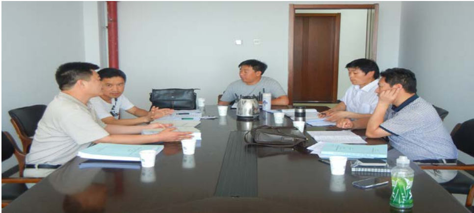
环境监理工作专题会议