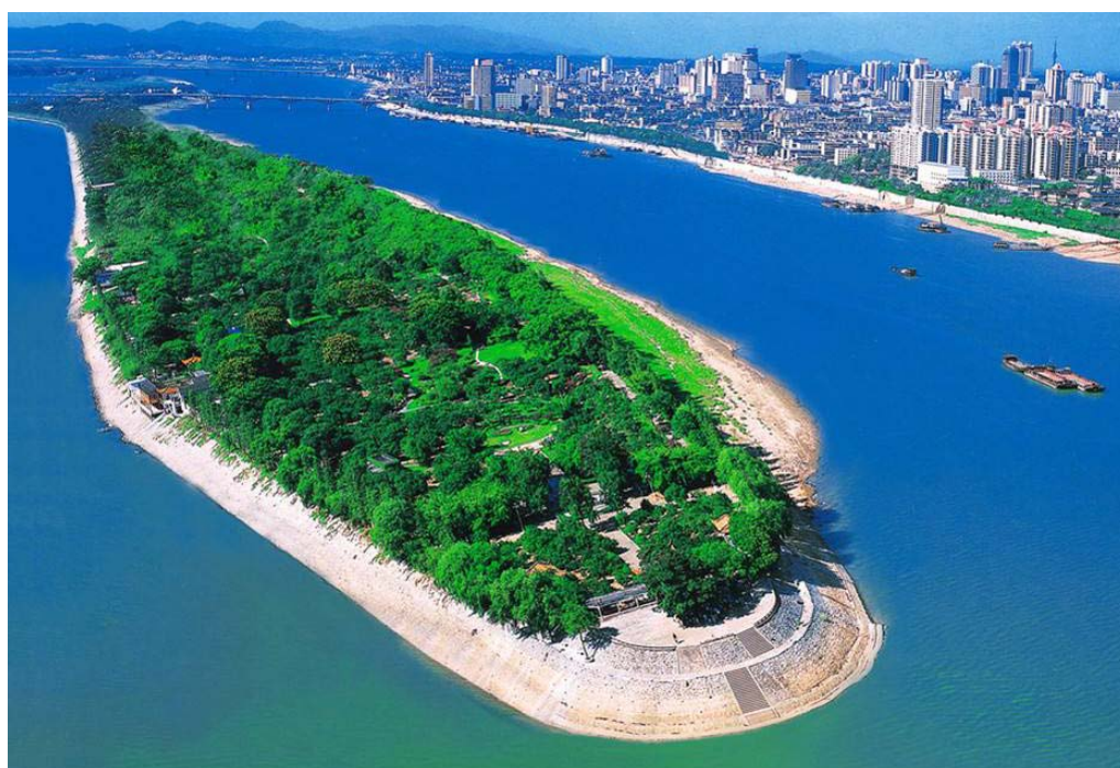
长沙市岳麓山橘子洲旅游区

两型认证工作是认证服务地方经济建设、绿色发展的有益尝试。该项工作获得了湖南省委省政府及国家认监委的高度肯定。湖南省两型委代表湖南省政府在全国认证认可工作暨部际联席会议上作了两型认证的典型发言，在全国产生了很好的影响。