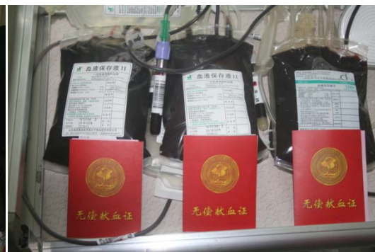
方圆江西公司积极参与无偿献血