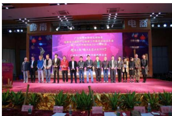
广州公司荣获“广州市 2016 年度节能优秀企业”

方圆河南公司档案室及文件柜所有文件均按年代按编号摆放整齐，做到定期清理过期档案，并将废旧档案盒翻新后重复利用。清理档案时派专人前往造纸厂全程监督材料落入纸浆池中，一方面保证了企业信息的安全性，另一方面减少资源浪费可以使废旧档案达到循环使用的目的。