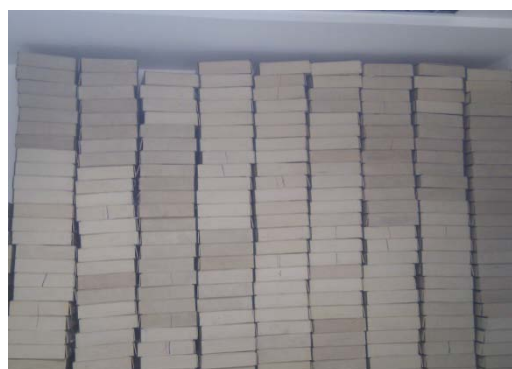
河南公司摆放整齐的旧档案盒