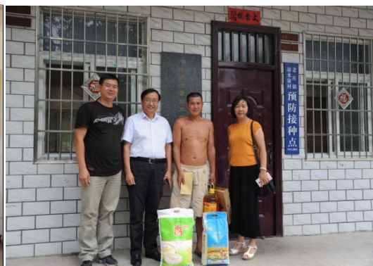
河南公司看望南阳市凉水泉村精准扶贫对象