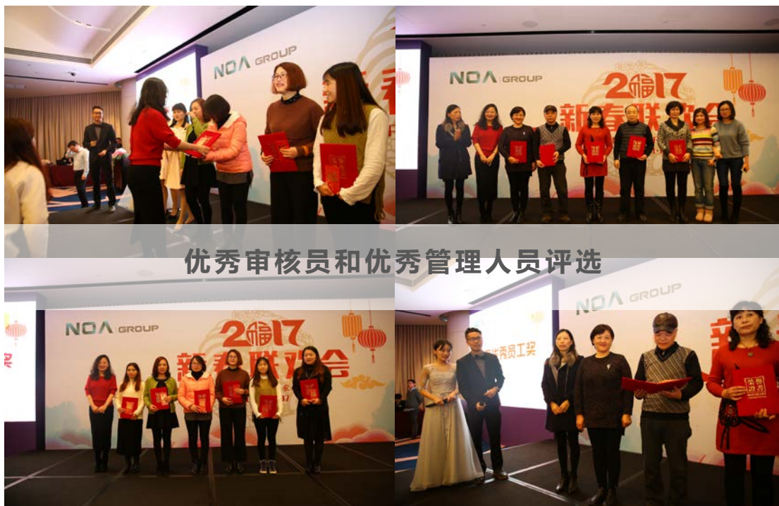
优秀审核员和优秀管理人员评选