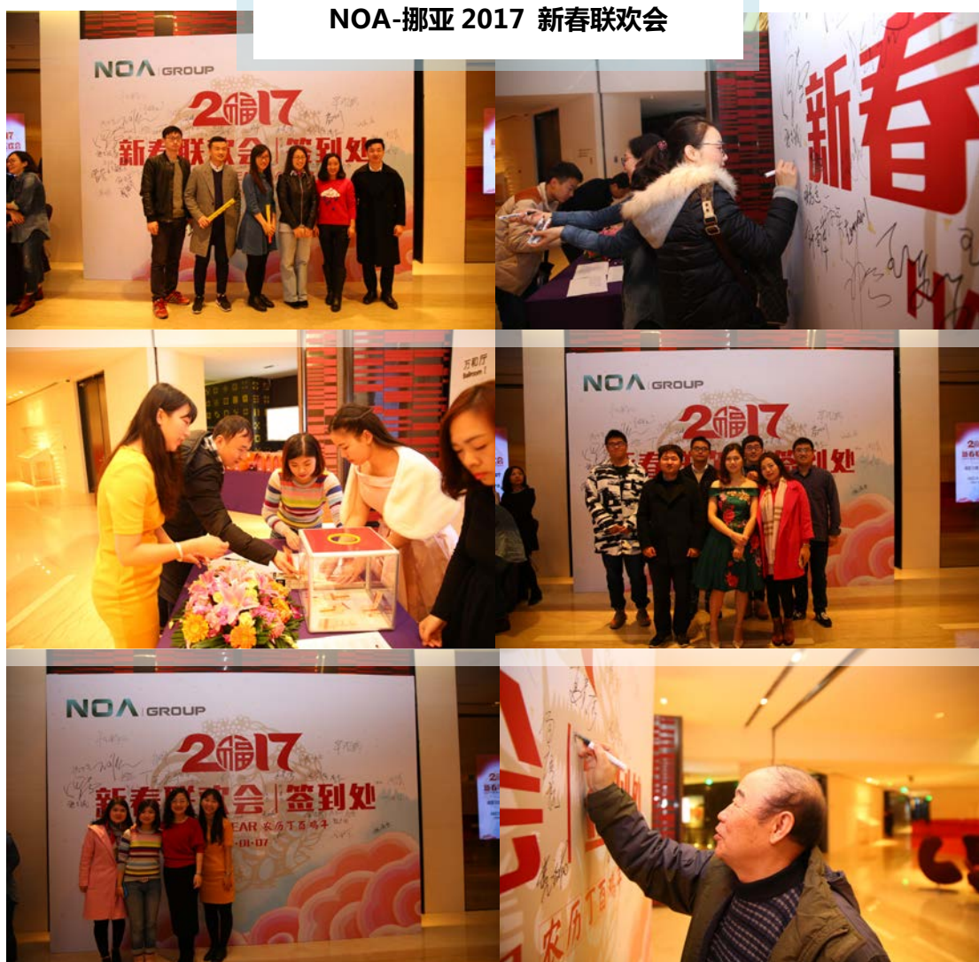
NOA-挪亚 2017 新春联欢会

挪亚为了更好的激励员工，还制定了绩效考核制度，可按员工当月的表现对其职务津贴、绩效奖金数额作调整。所有员工均有机会参与公司定期或不定期举行的各项活动，例如：旅游、聚餐、户外拓展等。