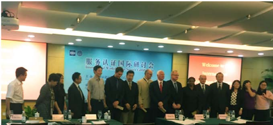
参加行业最新技术研 研（服务认证研讨会）

培训国际化，邀请俄罗斯 LLC 国际技术总监对挪威 FSC 审核员和认证管理人员进行专业培训