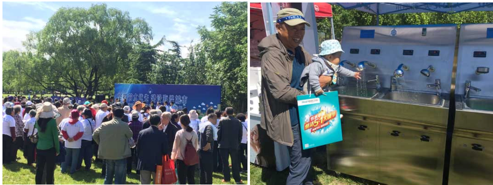
2016 年 5 月 15 日至 21 日是第二十五个全国城市节约用水宣传周，检验院参加了在海淀公园举行的以“坚持节水优先，建设海绵城市”为主题的北京市节水宣传周启动仪式。