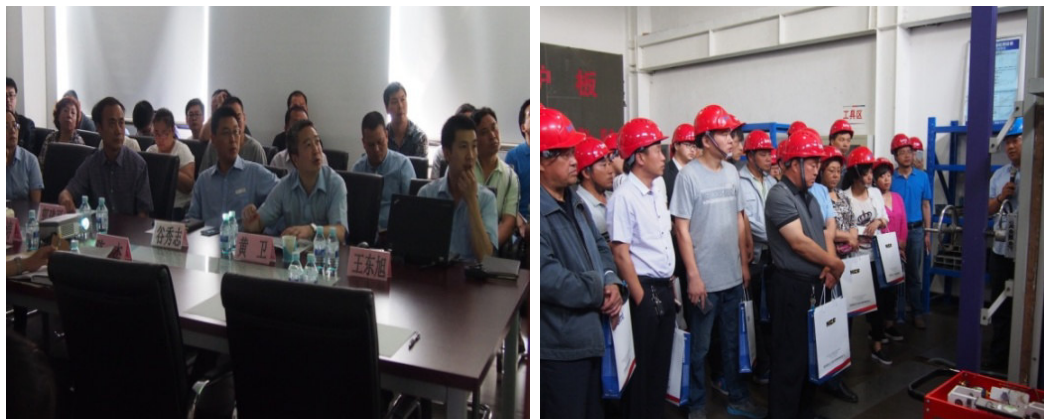
2016 年 5 月 18 日 , BMT 配合通州区质监局开展“质量提升大讲堂暨建筑外窗检测室开放日活动”, 30 家建筑外窗生产企业相关负责人参加此次活动。