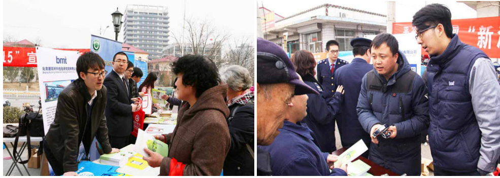
2016 年 3 月 15 日 , 检验院积极配合北京市工商部门开展主题为“新消费、我做主”的 3·15 宣传咨询活动。