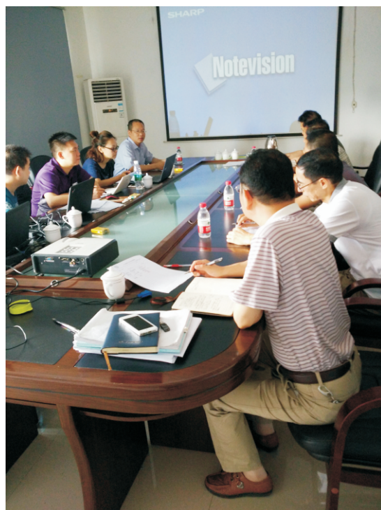
中帝制动器审核现场