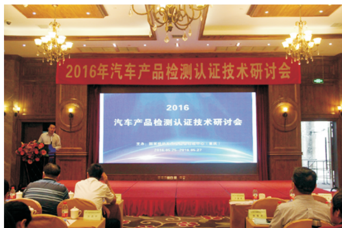
认证技术研讨会现场

认证技术交流。 2016年5月25-27日，公司参与中国汽研检测中心在成都主办的“2016汽车产品认证技术研讨会”，会议围绕“节能环保、新能源汽车及国内外检测认证技术”等热点话题，邀请了中机车辆技术服务中心、中国质量认证中心、中国环境科学研究院、北京理工大学、德国莱茵TUV、西班牙IDIADA等数位领导与专家发表了专题演讲，为客户提供延伸服务。