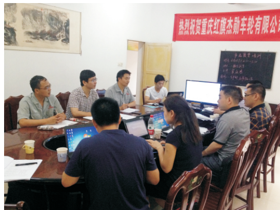
红旗车轮厂审核现场

增值服务。 公司通过认证活动为客户提供增值服务，实实在在地提升客户的质量管理水平，进而体现认证活动和认证机构的价值。在技术服务方面按照客户需求，有针对性的对汽车行业产品、过程等特点研究其实施方法、认证技巧、审核技巧，从而最终实现对客户的增值服务。