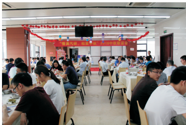
中秋单身员工联谊聚餐