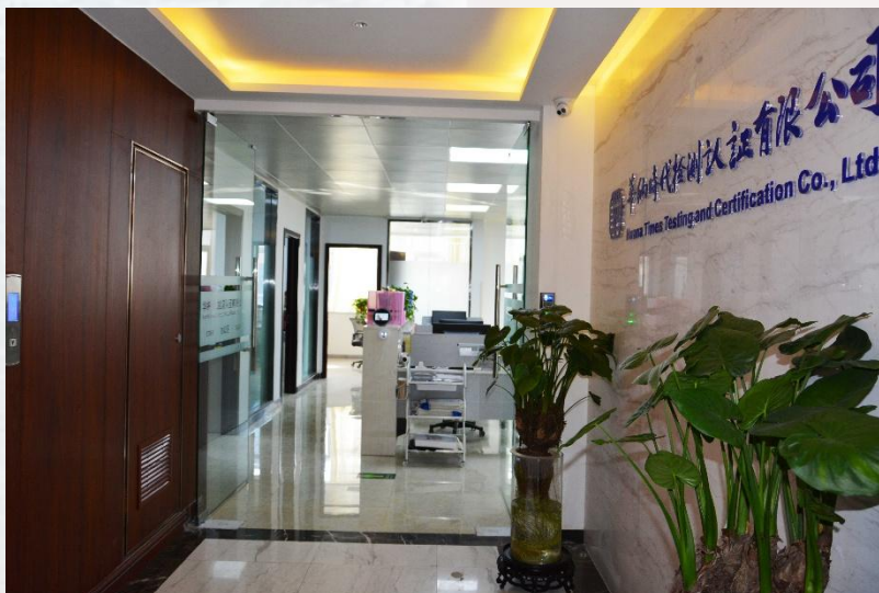
华纳公司位于大学科技园（东园）的办公场所

华纳时代的发展和进步离不开社会各方面的支持。我们在继续践行“责任·使命·担当”的企业精神的同时，用“合作共赢、全心服务”的经营理念、“改变从今天开始”的人力资源建设观，持续提升公司的社会责任承担能力、服务能力、人才理念，以创新、开放、包容的心态谱写华纳时代新篇章。