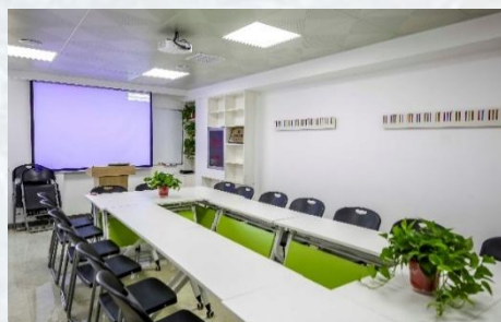
华纳员工办公环境