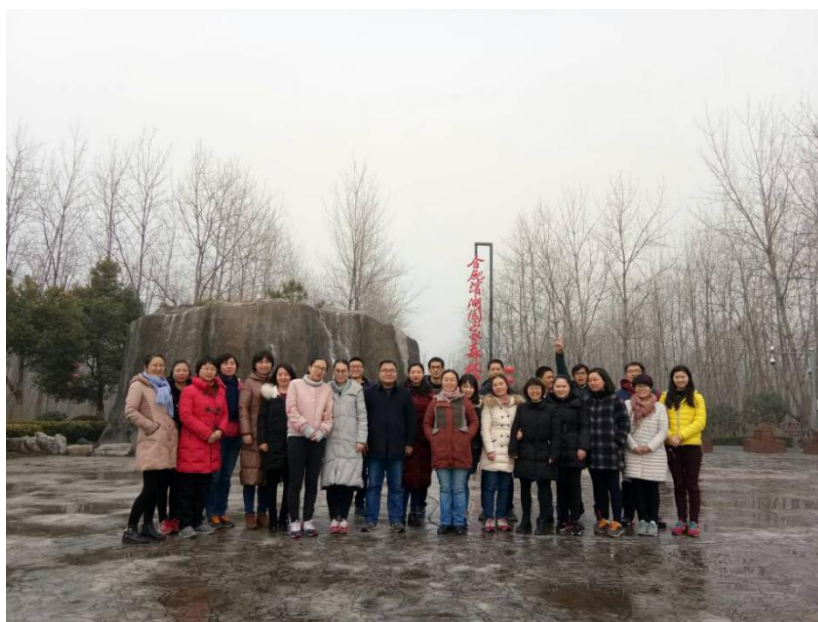
我院健步走比赛赛前合影