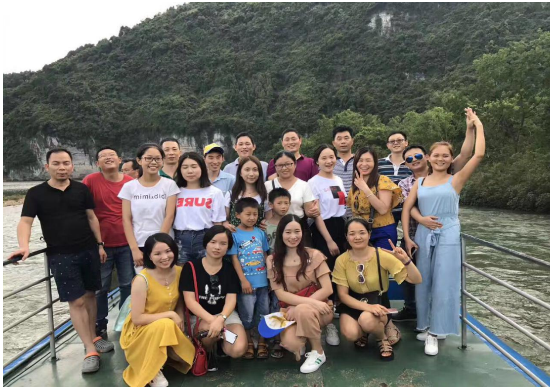
（2017年，公司组织员工去桂林旅游）