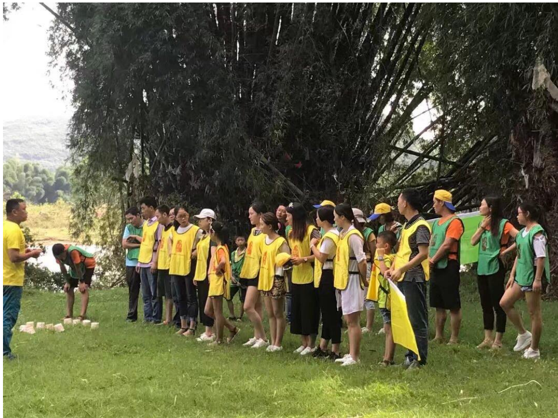
（2017年，公司组织员工进行户外拓展，提高意志力与执行力训