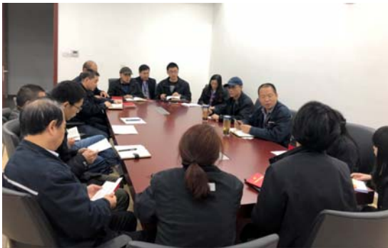
支部书记给党员上党课

公司通过发放征求意见表、设置意见箱、座谈走访等形式，广泛听取公司党员、员工和服务对象的意见建议。对收集到的情况进行梳理分析，通过组织生活会深入开展批评和自我批评，针对突出问题和薄弱环节提出整改措施。