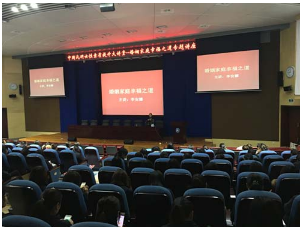
《婚姻幸福之道》讲座