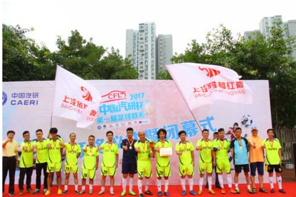
“中国汽研杯”重庆汽车行业足球联赛