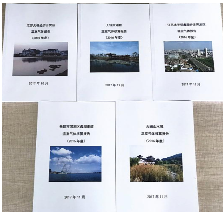
温室气体核算报告（滨湖区下辖五个街道）

国信公司积极提倡保护环境，节能减排，节约资源。在公司内部，积极推行无纸化办公，推动通过电脑系统来完成各项任务，这样既可以节约大量的纸张资源，还可以加强公司对于内部工作的监管，加强员工工作的便利性。公司要求员工做到人走熄灯，杜绝白昼灯和长明灯，尽量减少公共区域不必要的照明。加强自检自查，增强日常节能节水意识，对节能降耗工作的开展情况定期或不定期抽查并通报，实现全员驱动的节能降耗机制。