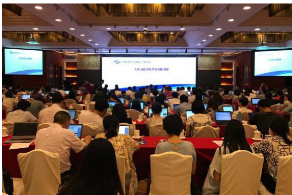
8月24日至25日，在京参加CNAS认证机构认可技术交流培训会。

以开展“责任认证、诚信认证”为己任，坚守底线，不碰红线，在认证活动的各个环节建立制度保障、监督机制和改进机制，以提升认证价值，服务于获证客户、社会与经济发展，提高认证的公信力和影响力。通过自身不断完善的管理体系的有效运行、技术领域划分与专业能力需求分析、人员能力持续评价系统的构建、认证合同的有效签订、审核方案的管理、认证决定的独立性运作、公正性委员会定期的审查、完善与公开的申投诉处理程序、认证人员行为规范的约束与监督，构成了机构内部监控机制，以确保本机构具有承担认证责任的能力。竭诚接受社会各界的监督，愿意向全社会真实地反映本公司业务活动对经济、环境及社会的影响。建立较为完善的监督和改进机制，通过多种渠道对社会责任的落实情况进行监督检查。对发现的社会责任问题，有相应的改进机制，明确改进责任和责任人，确定改进方法及时限，以保证认证机构的科学性、权威性。