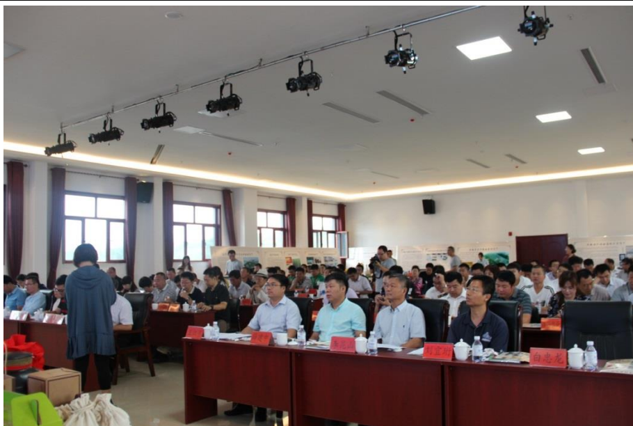
2、四川省中江县有机认证培训 四川省中江县 2017 年 7 月 14 日