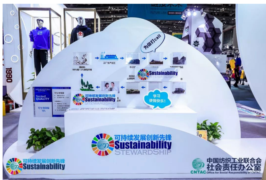
德国海恩斯坦可持续展区——生物降解

2018年9月28日，由中国纺织工业联合会主办的“2018中国纺织服装行业社会责任年会”在中国国际服装服饰博览会秋季展(简称 CHIC 秋季展)盛大召开。其中的一大亮点是可持续发展专区——由中国纺织工业联合会社会责任办公室组织，德国海恩斯坦、李宁和兰精集团联合展出，主要针对化学品管理、碳管理、水管理、循环再利用管理创新四大可持续主题内容。