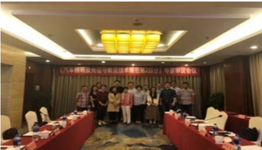
附图 3：专家审议会议