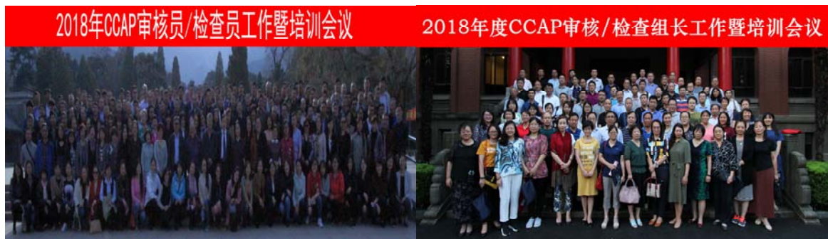
附图5：2018年度审核员/检查员工作会议

2) 2018 年，本着“强责任、提能力、抓细节、促规范”的指导思想，狠抓审核/检查员队伍建设。公司按 CNCA、CNAS、CCAA 关于认证人员继续教育的要求，对 2018 年认证人员继续教育的工作进行前期策划，制定具体实施方案，积极实施，督促全体认证人员完成，确保公司认证人员按计划完成了 2018 年度的继续教育；公司在 2018 年 3 月和 8 月组织召开了 2018 年度审核/检查员会、组长工作和培训会议，对认证主体责任和放管服的文件进行了通报学习；对全体审核/检查员的评价结果进行了通报；并建立审核/检查员分级管理制度，以保证了审核员队伍的整体工作质量。