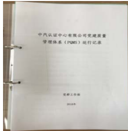
附图 10 党群工作部运行记录手册