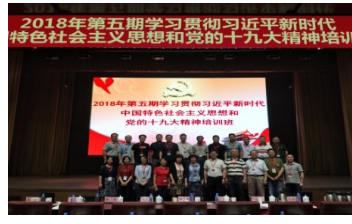
附图8班子/中干/支书集中轮训