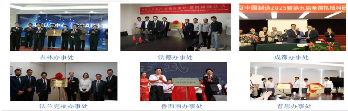
附图2：公司办事处成立照片

4) 市场体系建设和服务前移情况：构建公司市场体系，布局境内外业务网络。基于对行业发展的研判、机构要实现跨越式发展和服务前移的诉求，强力开展境内、外市场开拓和服务前移，2018 年无新增办事处，现有 14 个办事处。积极布局国内国际业务合作平台，为“十三五”国际化发展迈出了历史性的步伐。