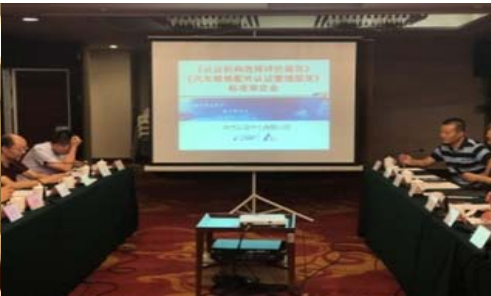
附图 4 标准审定会