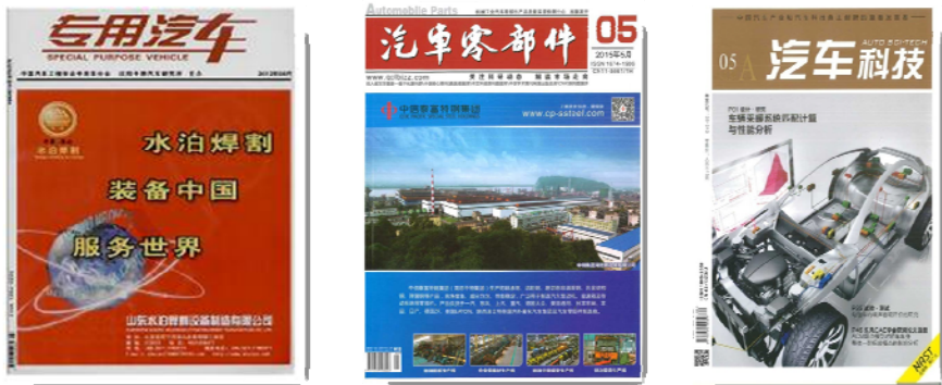
附图15：CCAP选用宣传杂志

与中国汽车维修行业协会签订了汽车零部件后市场战略合作协议，围绕“同质配件”从标准制修订、认证评价、检测服务全价值链进行合作研发，并与安徽普思标准技术有限公司联合在“奇瑞汽车”产业链平台进行试点示范，旨在积极培育新的认证、检测服务产品线，积极探索公司认证结构调整。