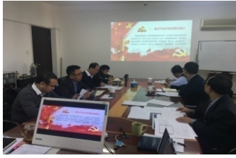
附图7 理论中心组学习