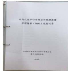
附图 11 党支部运行记录手册