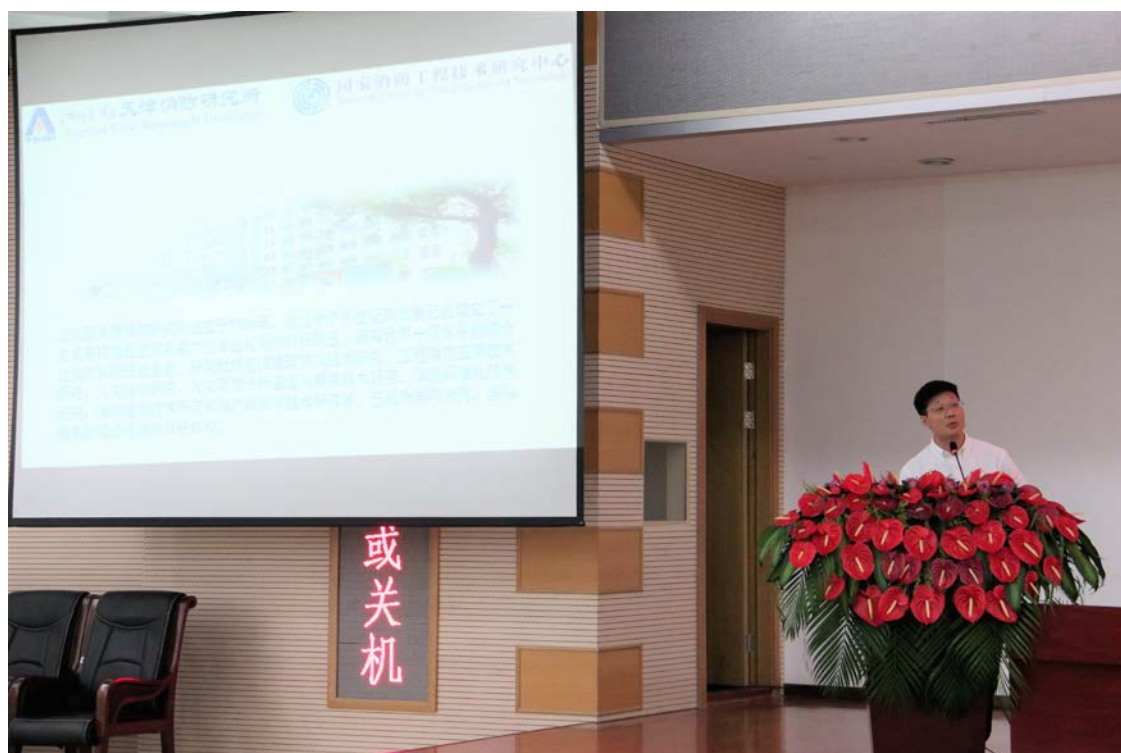
赴浙江同消防协会及相关单位开展交流

国际门业博览会、受邀参加“首届中国国际进口博览会‘认证认可检验检测服务国际贸易便利化’论坛”、至江苏太仓市参加“防火门窗五金技术发展论坛”并同期主办“消防产品自愿性认证研讨会”、赴浙江省温州市参加 2018 中国五金锁具·门窗产业年度峰会暨物联网+智能制造论坛等活动，对中心建设产品认证品牌，深入市场、贴近与行业和客户距离，优化并继续落实主体责任及国家“放管服”政策精神等方面起到了极大的促进作用。