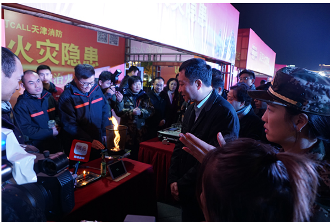
参加天津市 2018 年“119”消防宣传月启动仪式