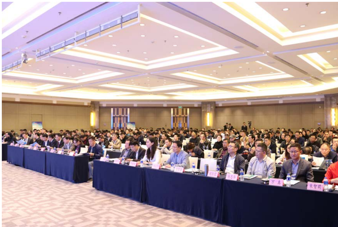
受邀赴江苏苏州防火门窗五金技术发展论坛同相关单位 开展交流