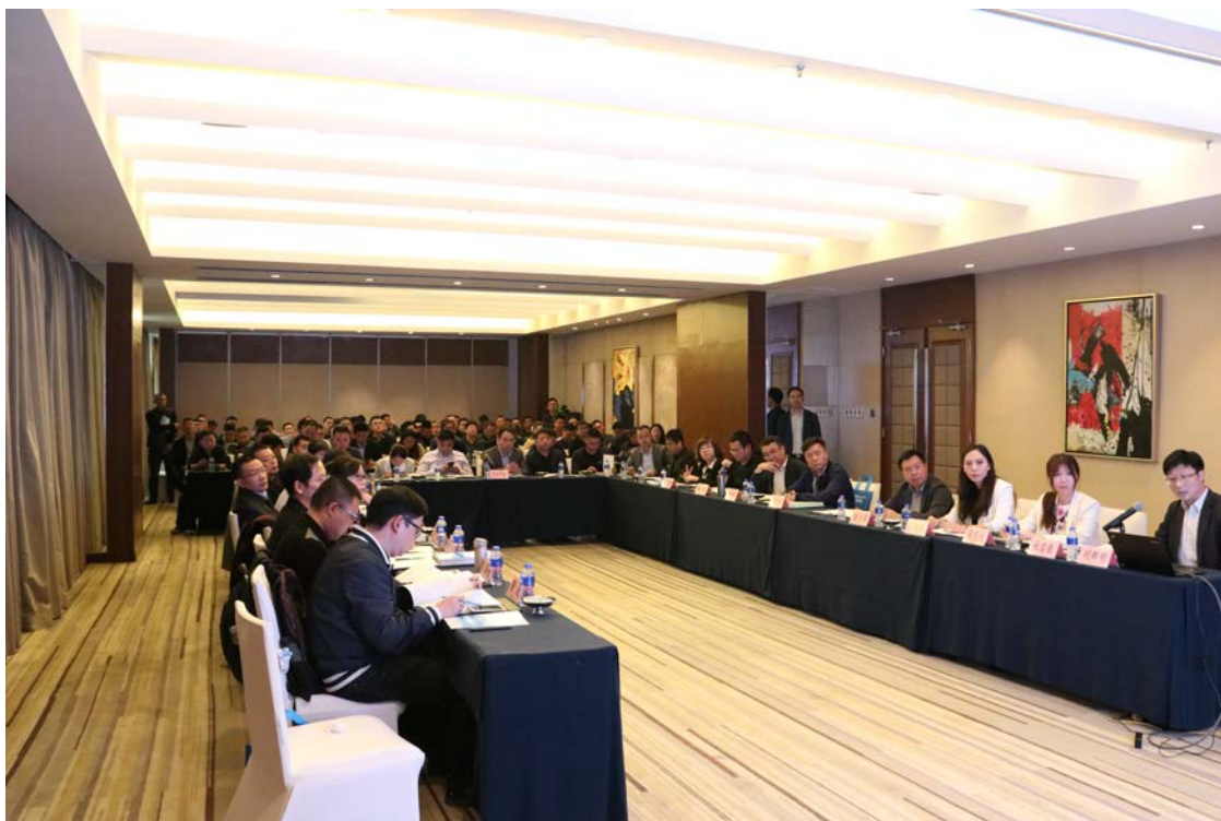
于江苏苏州成功举办消防产品自愿性认证研讨会