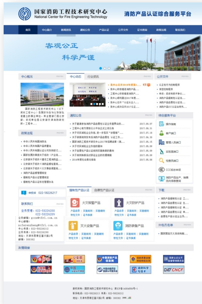
消防工程中心官网

②结合我中心认证业务发展和信息化平台建设，采用多渠道开展业务宣传工作，充分利用认证官网、业务系统、微信公众平台等媒介，积极发布有关产品认证程序、要求、通知等动态信息。