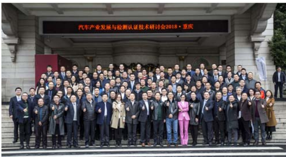
汽车产业发展与检测认证技术研讨会

认证技术交流。2018 年 12 月 7 日，凯瑞认证参与母公司中国汽车工程研究院股份有限公司主办的“汽车产业发展与检测认证技术研讨会”，中国汽研检测中心将借助搭建的技术服务咨询平台、数据共享平台、品牌推广平台，铸造国内及国际强制性及自愿性认证品牌和海外认证通道品牌，致力于为合作伙伴提供更加高效高质量的服务，共同推动汽车产业转型升级，实现由高速增长向高质量发展转变，共创美好未来。