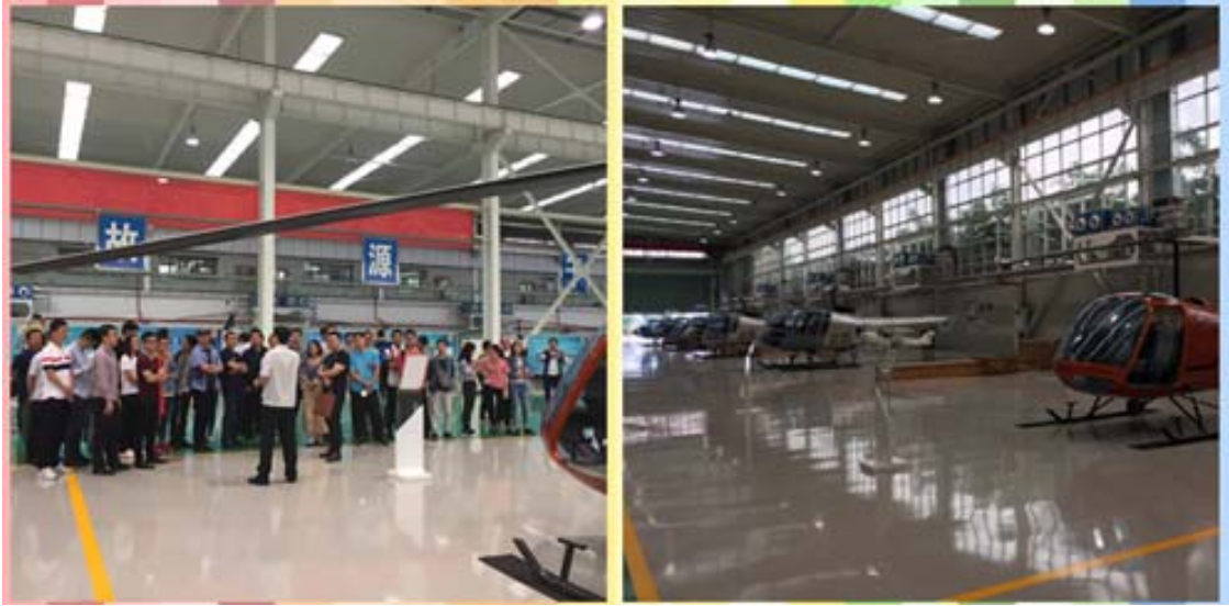
五四主题团日联建活动