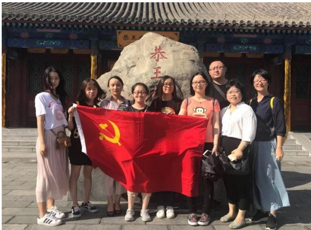
图 3 部分党员开展组织活动