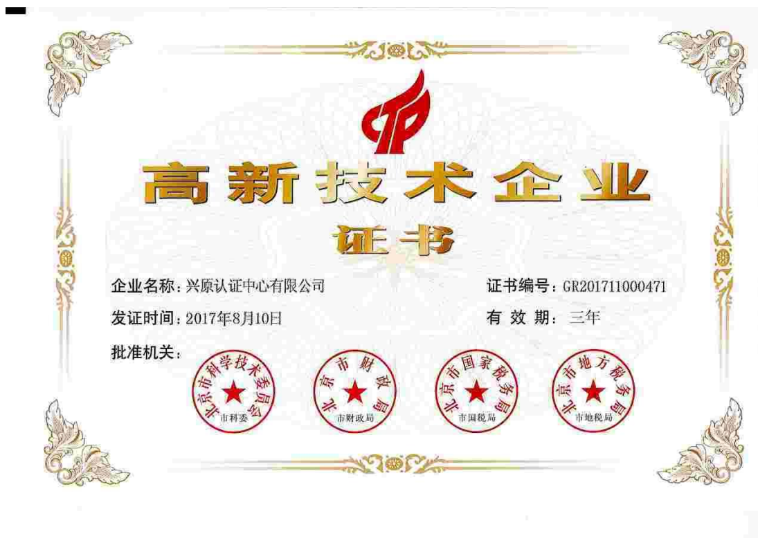
图 5 保持了高新技术企业证书