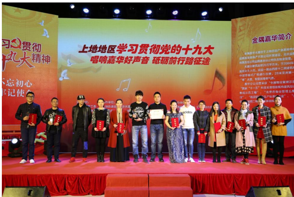
图 8 公司派代表参加社区歌咏比赛

2018 年，利用认证认可日的时机，积极向社会宣传认证认可知识。2018 年，随着规范稳健的经营，我们直接解决了近 866 名专兼职员工的就业，向国家缴纳税费近 2100 万元，为 13000 多家客户提供了认证服务，具有明显的社会效益，是企业服务社会的本质内涵。