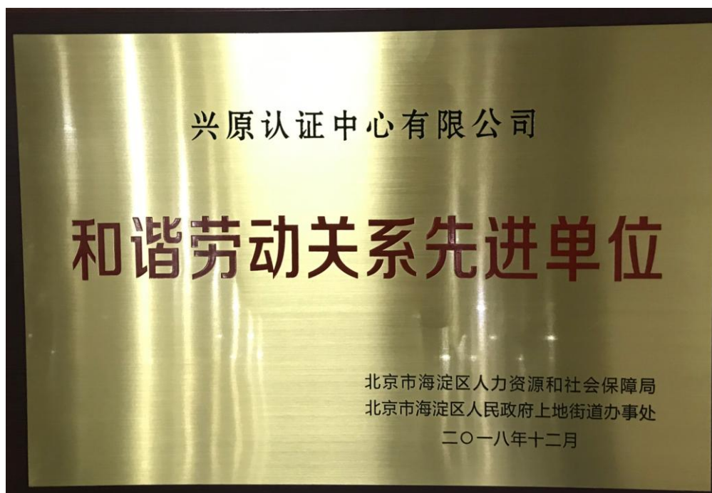
图 6 获得和谐劳动关系先进单位称号