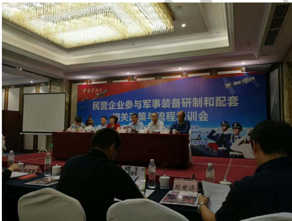
图 10 兴原承办的军民融合活动

2018 年,与地方国防科工办合作,为浙江、陕西等军民融合产业园区提供了技术支持。