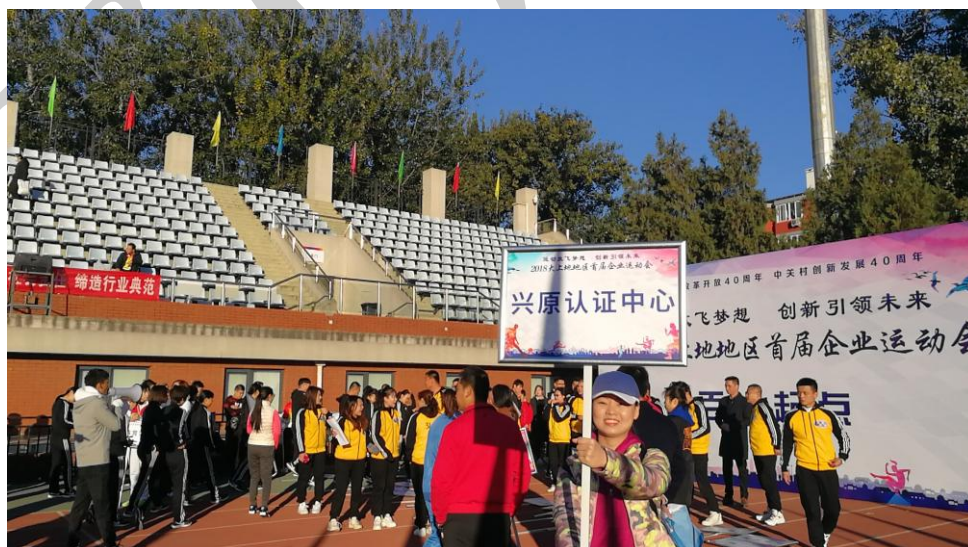
图 9 公司派代表参加上地园区运动会