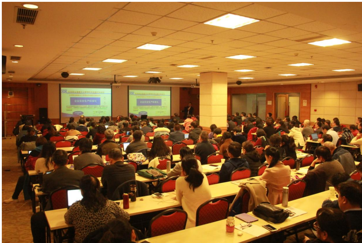
图 2 组织各地审核员进行培训

积极宣传，动员审核员参与良好案例评选活动，共收到良好案例 72 个，经过将近一个月的网络评议，共有 36 人参加网络评议，结合领导、培训部和审核部审议人员参与，评选出良好认证审核案例共 16 个。