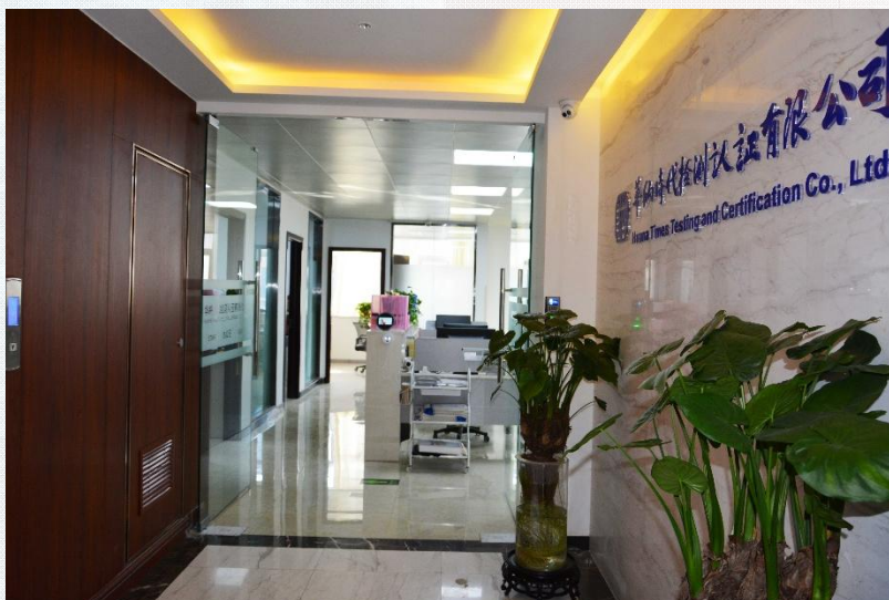
华纳公司位于大学科技园（东区）的办公场所

华纳时代的发展和进步离不开社会各方面的支持。我们在继续践行“责任·使命·担当”的企业精神的同时，用“合作共赢、全心服务”的经营理念、“改变从今天开始”的人力资源建设观，持续提升公司的社会责任承担能力、服务能力、人才理念，以创新、开放、包容的心态谱写华纳时代新篇章。