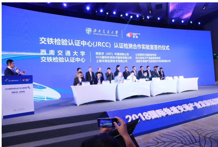
认证检测合作实验室签约仪式

本机构作为政府重点支持的轨道交通产业高技术服务平台和轨道交通领域的检验检测认证服务机构，在 2018 年成都国际轨道交通大会新都分会，与 SGS 通标标准技术服务有限公司、公安部四川消防研究所、成都海瑞、上海华慧等国际国内知名检测机构进行了认证检测实验室的签约仪式。