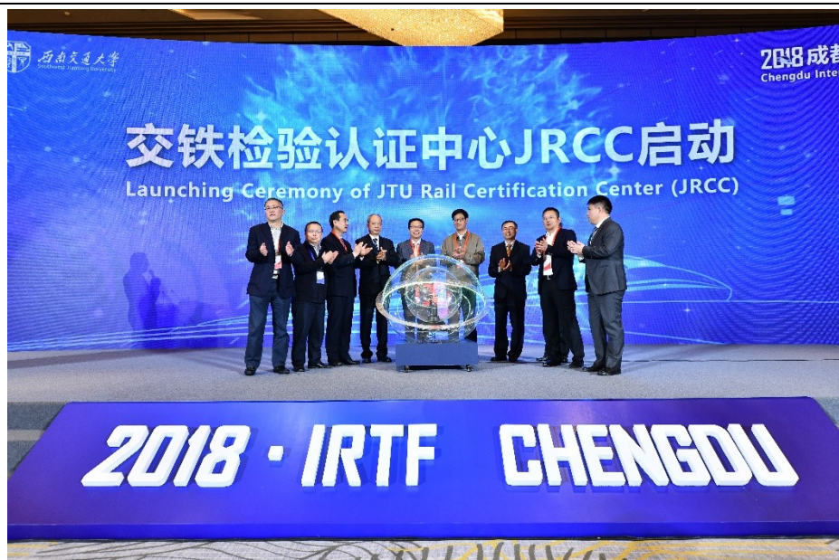
交铁检验认证中心启动仪式

本机构作为政府重点支持的轨道交通产业高技术服务平台和轨道交通领域的检验检测认证服务机构，在 2018 年成都国际轨道交通大会新都分会，与 SGS 通标标准技术服务有限公司、公安部四川消防研究所、成都海瑞、上海华慧等国际国内知名检测机构进行了认证检测实验室的签约仪式。