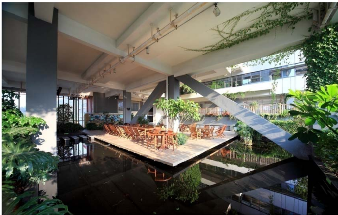
国家首批三星级绿色建筑“建科大楼”

(3) 2012 年起，建科院推动了李克强副总理与欧盟委员会主席签署的中欧可持续城镇化合作伙伴旗舰项目“深圳国际低碳城”的落地，为该项目进行总体规划策略、低碳发展指标体系等框架设计，将绿色低碳从单体建筑引向城市（城区）。该项目开创了在高碳排放低端产业建成区向低碳产业转型的滚动开发和低冲击开发模式，并由此获得中国国际经济交流中心及美国保尔森基金会联合授予的“2014 可持续发展规划项目奖”（每届仅一个获奖项目）。国家发展和改革委员会“首批国家低碳城（镇）试点”，以及十佳城镇化示范项目、中国低碳发展年度典范、APEC 低碳城镇杰出规划奖等。在该项目核心区，由建科院策划、设计并运营管理的低碳城会展中心，2013 年起在该场地已成功承办 4 届“深圳国际低碳城论坛”，2016 年参会人员近 3000 人，来自近 50 个国家和地区，已成为深圳市主办的高交会之后的第二国际知名会议。