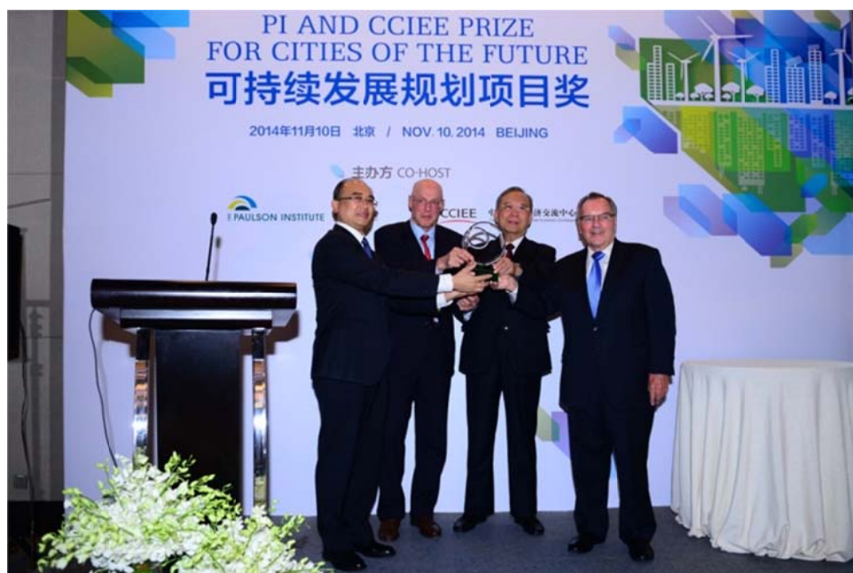
曾培炎向深圳市长许勤颁发“2014 可持续发展规划项目奖”