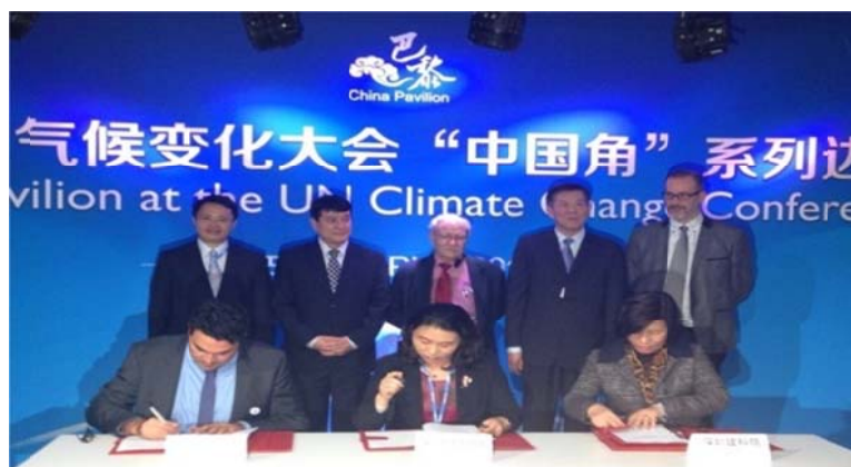
参加 2015 年联合国气候变化 COP21 巴黎大会