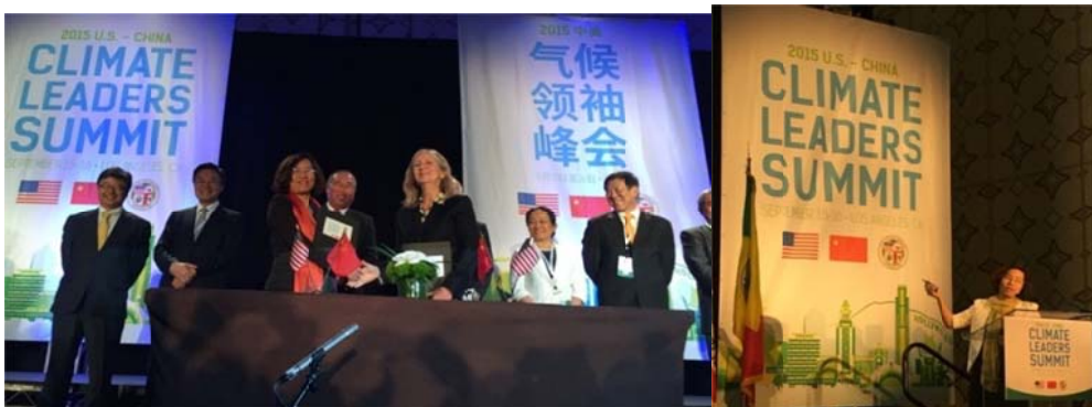
在洛杉矶召开的 2015 年首届中美气候领袖峰会并介绍中国绿色建筑和生态城市发展成绩和模式

绿色规划；拥有 8 个绿色技术公共服务平台（包括 3 个国家级平台）；与美国劳伦斯—伯克利国家实验室、美国雪城大学、能源基金会、荷兰国家应用科学院、英国卡迪夫大学、德国弗劳恩霍夫研究所、伍珀塔尔研究所等建立了长期、广泛的国际合作；参与系列国际会议论坛，如 2015 年 9 月在洛杉矶召开的 2015 中美气候领袖峰会上演讲，得到美国白宫网站等报道，2015 年 12 月参加联合国气候变化巴黎大会，每年承办深圳国际低碳城论坛等，建科院在国内外行业内品牌知名度日益提高。