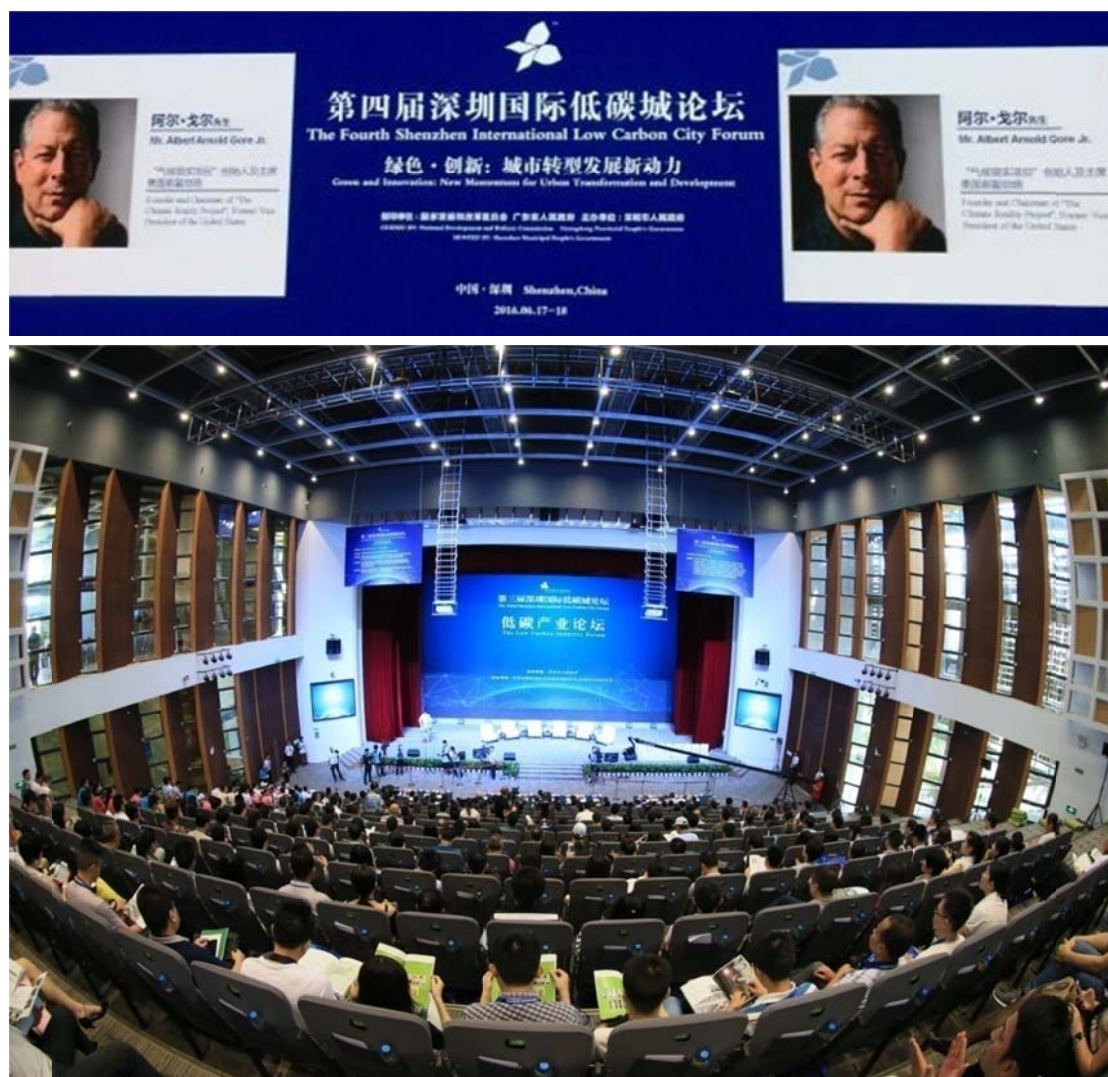
承办的深圳国际低碳城论坛现场

(4) 通过标准制定，将绿色相关技术公之于众，为行业 and 公众服务，并推动行业向绿色低碳发展模式的变革。一是通过建立的 12 个国家、省、市三级绿色技术公共服务平台和代表我国建筑节能监管最高水准的全国首个建筑能耗监测平台，为全行业服务。二是主、参编《绿色建筑评价标准》《民用建筑绿色设计规范》等绿色节能标准规范 100 多项，引领行业发展。三是 2010 年起每年编制《中国低碳生态城市发展报告》，发布国内 287 个城市的“优地指数”(UELDI，城市生态宜居发展指数)，代表国内生态宜居城市评价最高水准。