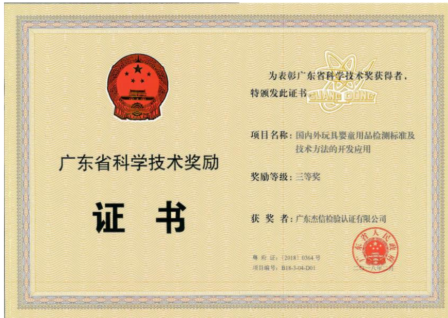
广东省科学技术奖证书

公司申报并获得广东省企业研究开发省级财政补助资金、申报广东省科学技术奖，并获科学技术进步奖。