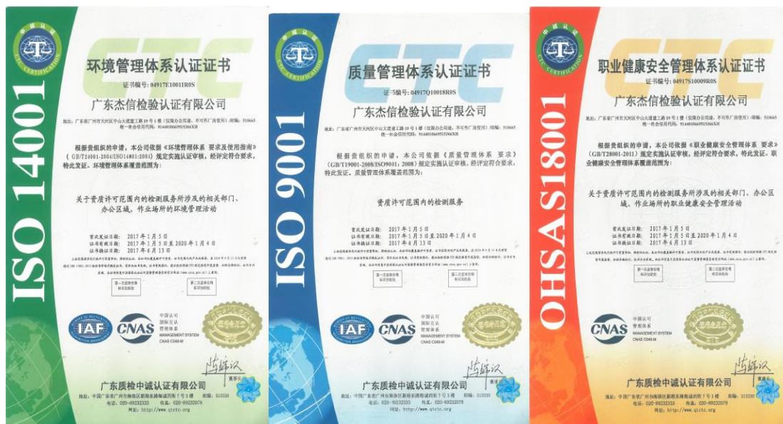
管理体系认证证书

公司也获得中国合格评定国家认可委员会 CNAS 和美国 CPSC 的认可，且经国家质量监督检验检疫总局许可，可接受对外贸易关系人或者国内外检验机构及其他有关单位的委托，办理进出口商品检验鉴定业务，是值得信赖的第三方公证检测机构。同时，公司已获得世界最大的玩具公司美泰和孩之宝公司的认可，其发出的证书得到广泛的认可。