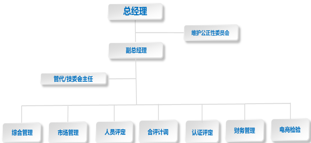
国检公信（北京）检验认证有限公司组织架构