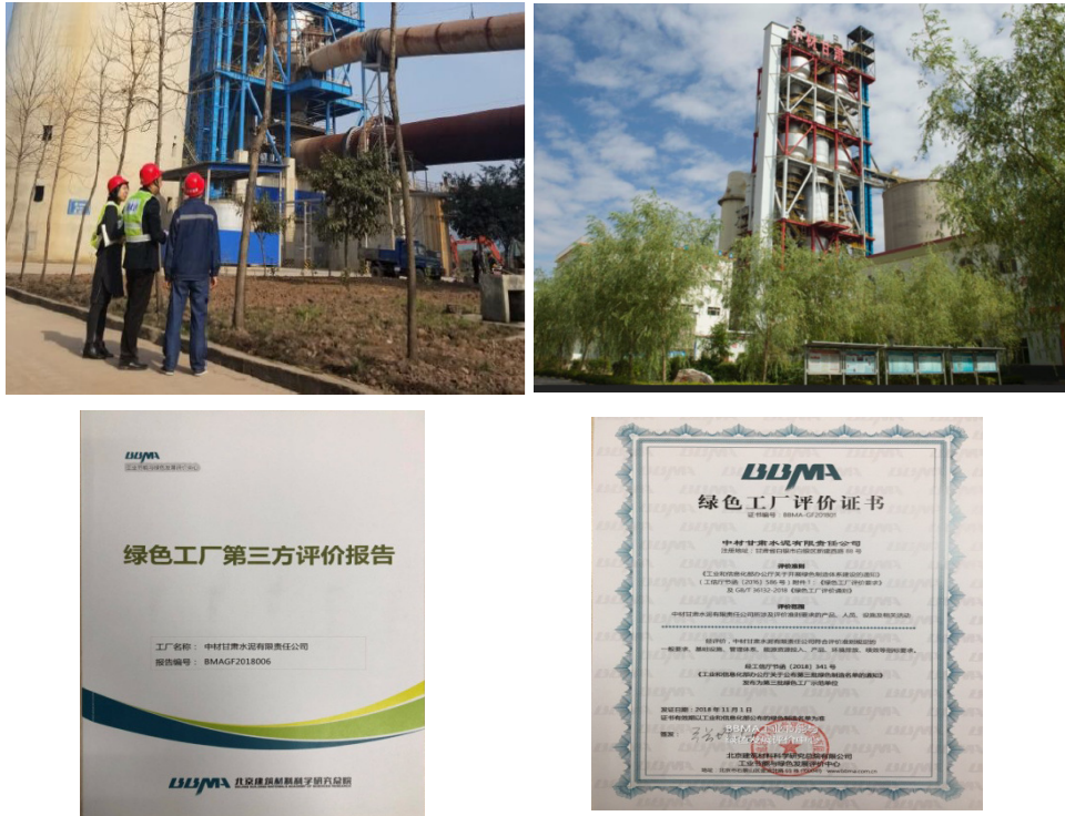
绿色制造体系评价