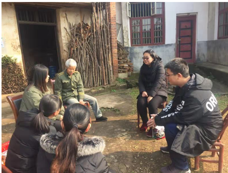
听老兵讲参站事迹