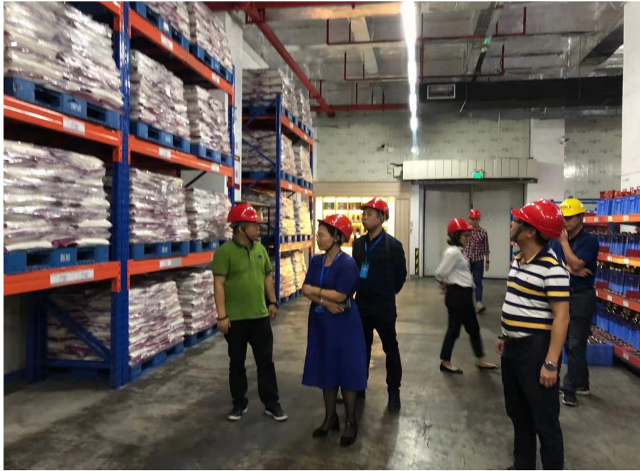
评审现场：深圳市深粮多喜米商务有限公司

2019 年公司技术骨干作为“第十七届深圳知名品牌评审”的评审专家，义务为深圳市总工会提供公正的评价服务，受到了一致好评。