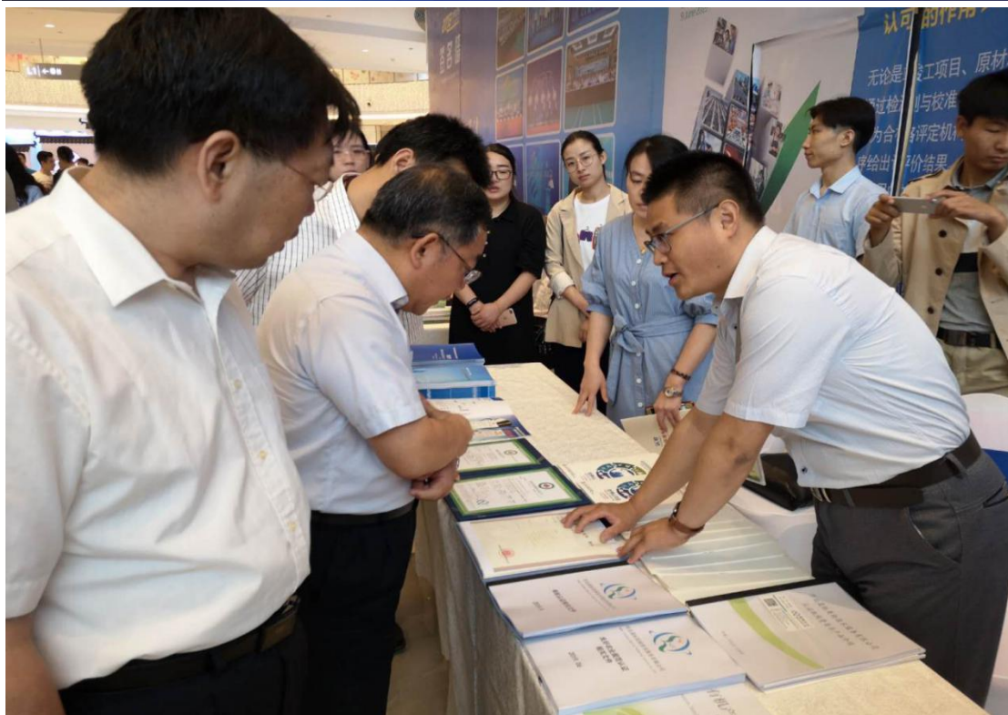
2019 年 6 月 6 日世界认可日宣传活动