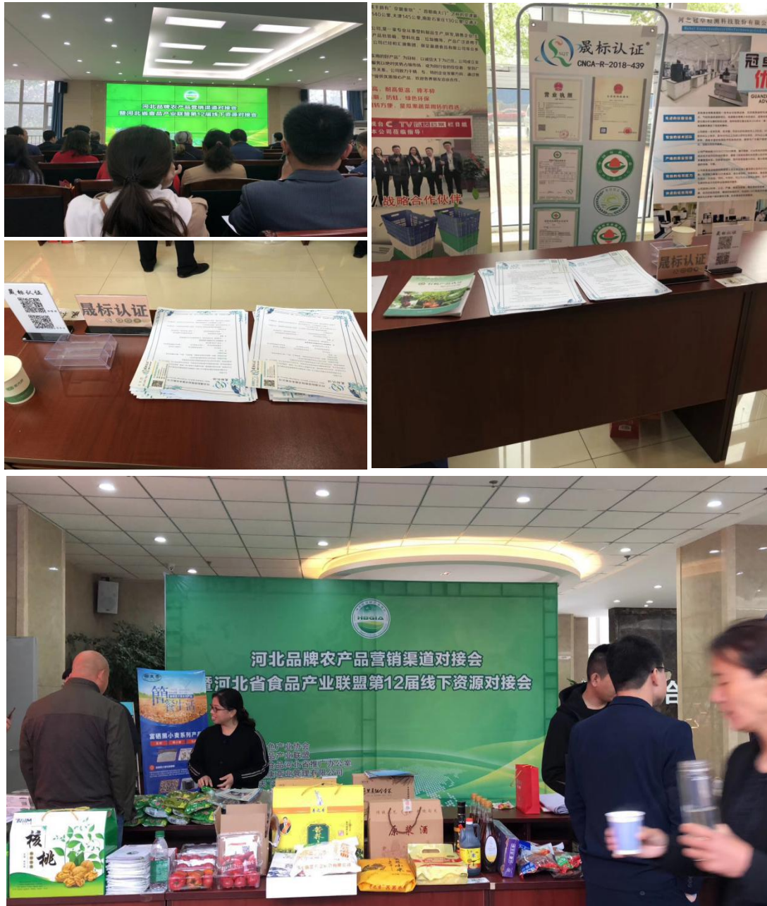
2019 年 4 月 25 日河北品牌农产品对接会