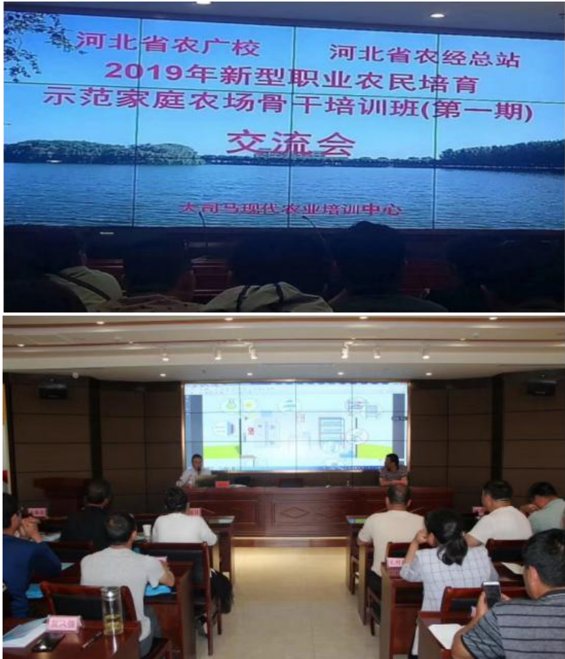
5 月 21 日河北省职业农民教育提升政治任务