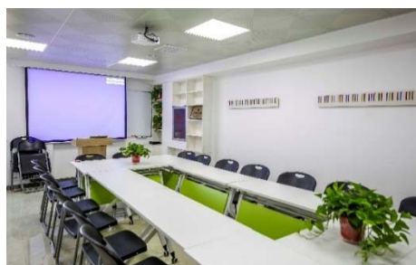
华纳员工办公环境