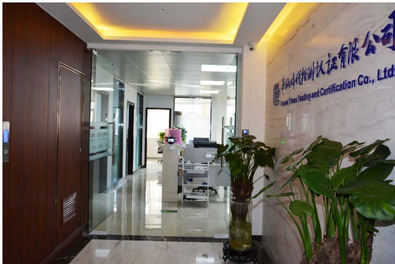
华纳公司位于大学科技园（东园）的办公场所

华纳时代的发展和进步离不开社会各方面的支持。我们在继续践行“责任·使命·担当”的企业精神的同时，用“合作共赢、全心服务”的经营理念、“改变从今天开始”的人力资源建设观，持续提升公司的社会责任承担能力、服务能力、人才理念，以创新、开放、包容的心态谱写华纳时代新篇章。