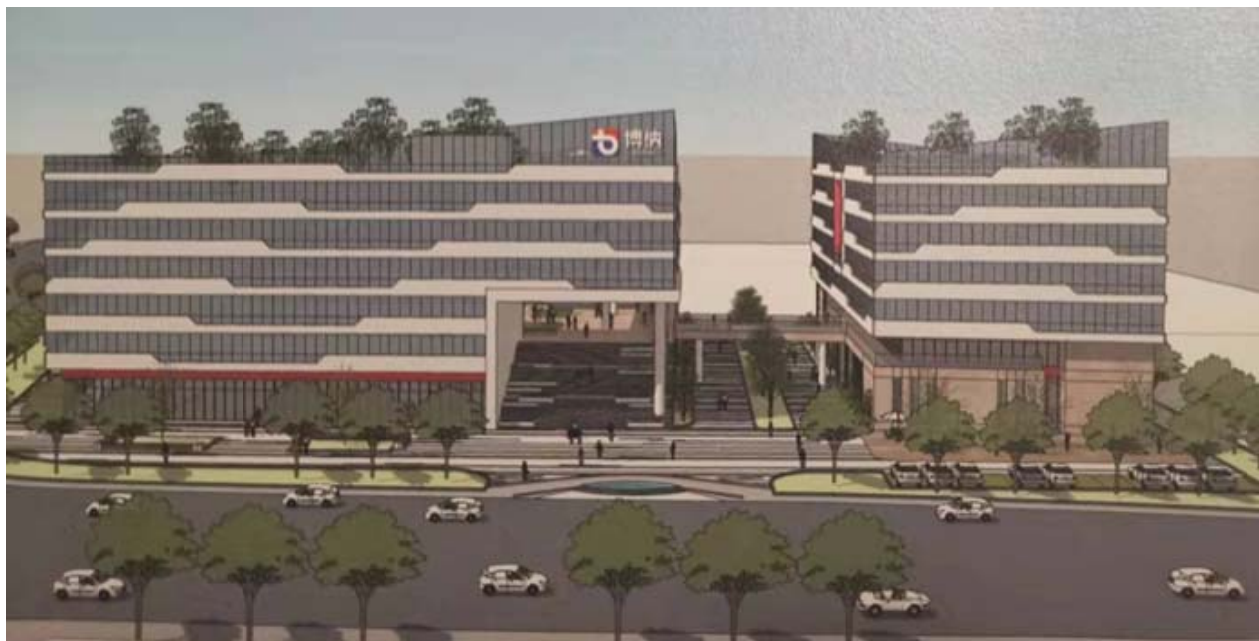
博纳麓谷基地规划图

博纳检测认证有限公司是一家集计量校准、产品检测以及认证为一体的独立的第三方计量、检测、认证服务机构。公司成立于 2013 年，办公地址位于长沙市麓谷高新开发区麓云路 18 号，拥有办公区域 1500 多平方米，认证服务配套办公区域 300 多平方。2019 年公司与长沙高新区管委会签订“项目入驻合同”购入 20.3 亩净用地，随着博纳麓谷基地建设，公司将继续秉承“科学公正、严谨高效、质量第一、客户至上”的服务宗旨，以精准助推产业发展，以公信服务健康生活，致力于成为受人尊重并具国际竞争力的检测认证机构。