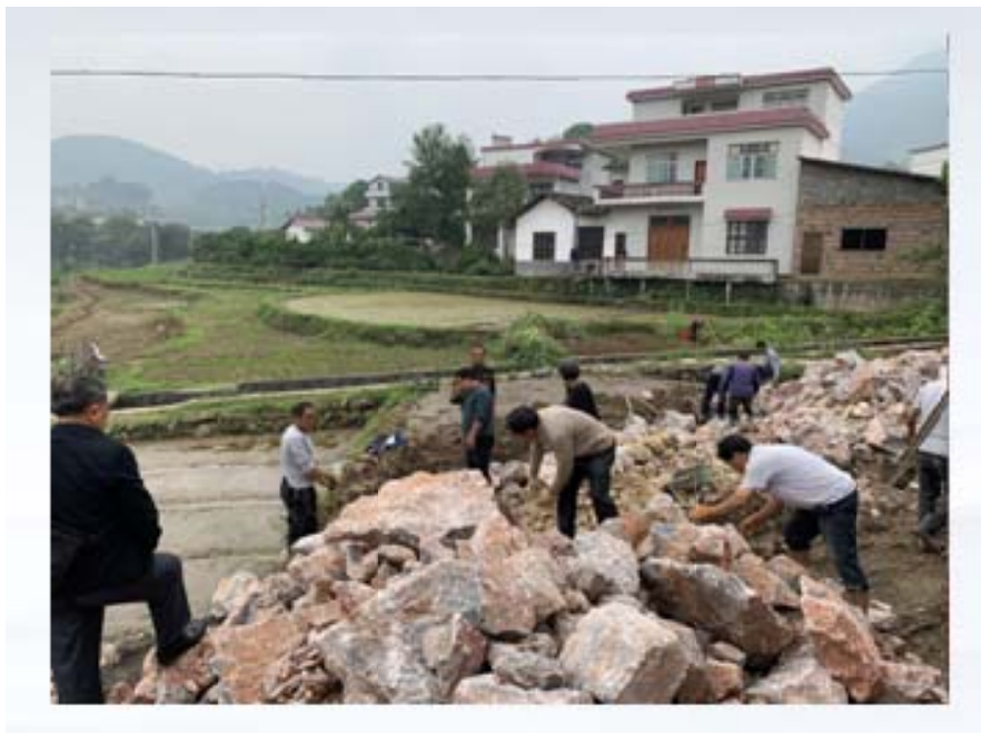
资助邵阳新宁县村村通路修建