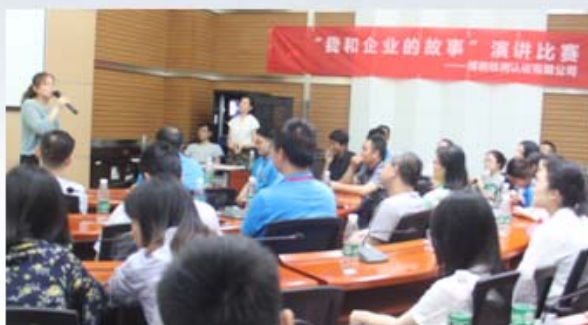
我和企业的故事—演讲比赛