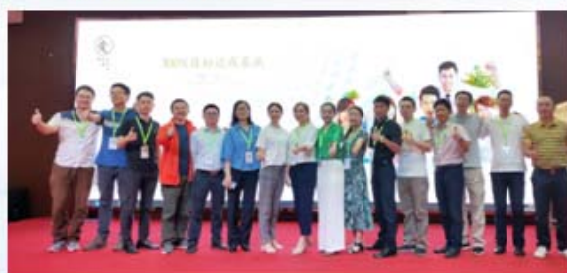
员工100%目标达成培训