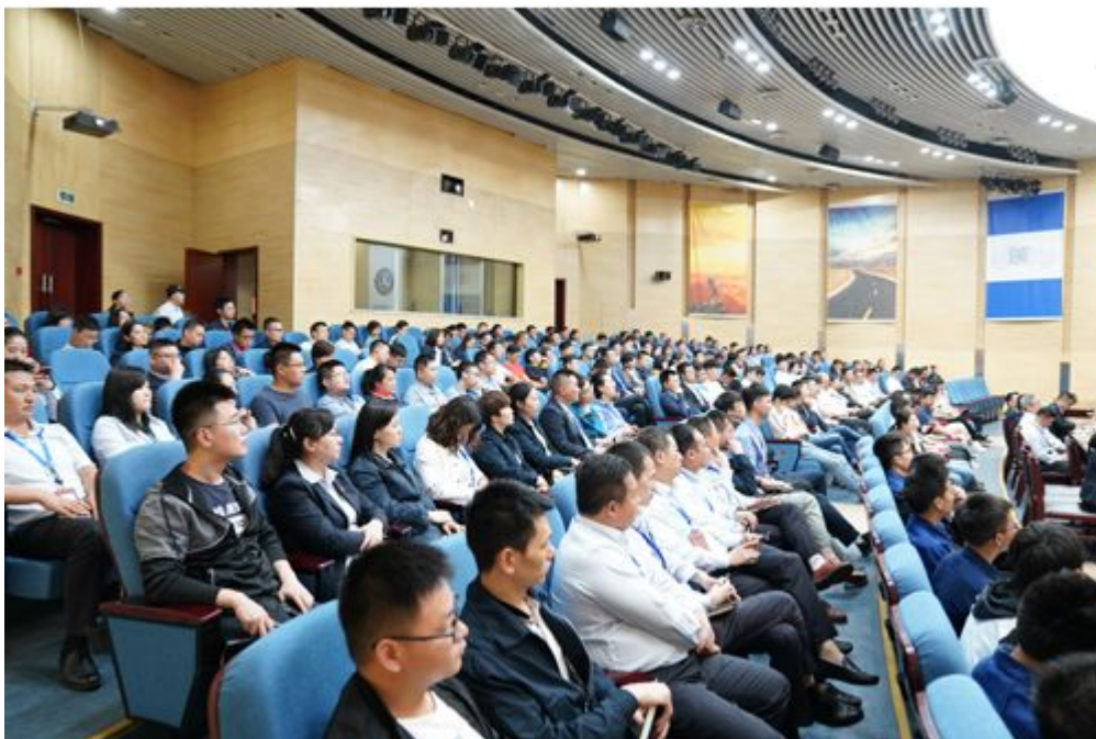
青春心向党 建功新时代主题会

为纪念五四运动 100 周年，5 月 5 日公司团委组织开展“青春心向党 建功新时代”五四表彰大会暨革命后代讲家风活动，旨在弘扬“五四”精神，表彰先进典型，让公司团员青年接受一次“沉浸式”的精神洗礼，进一步感召团员青年树立远大理想、传承革命精神。