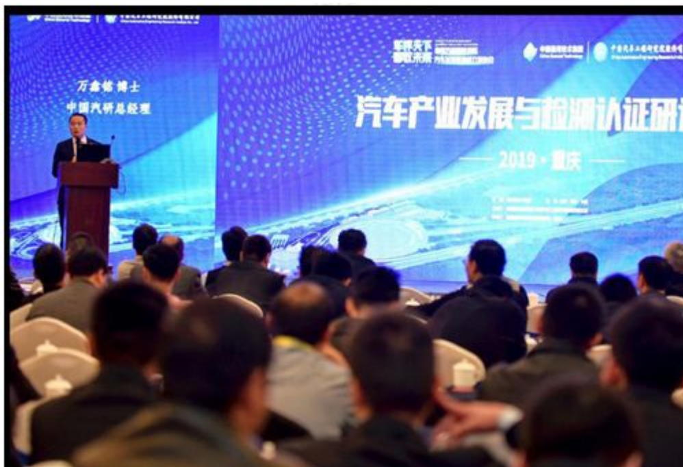
汽车产业发展与检测认证技术研讨会