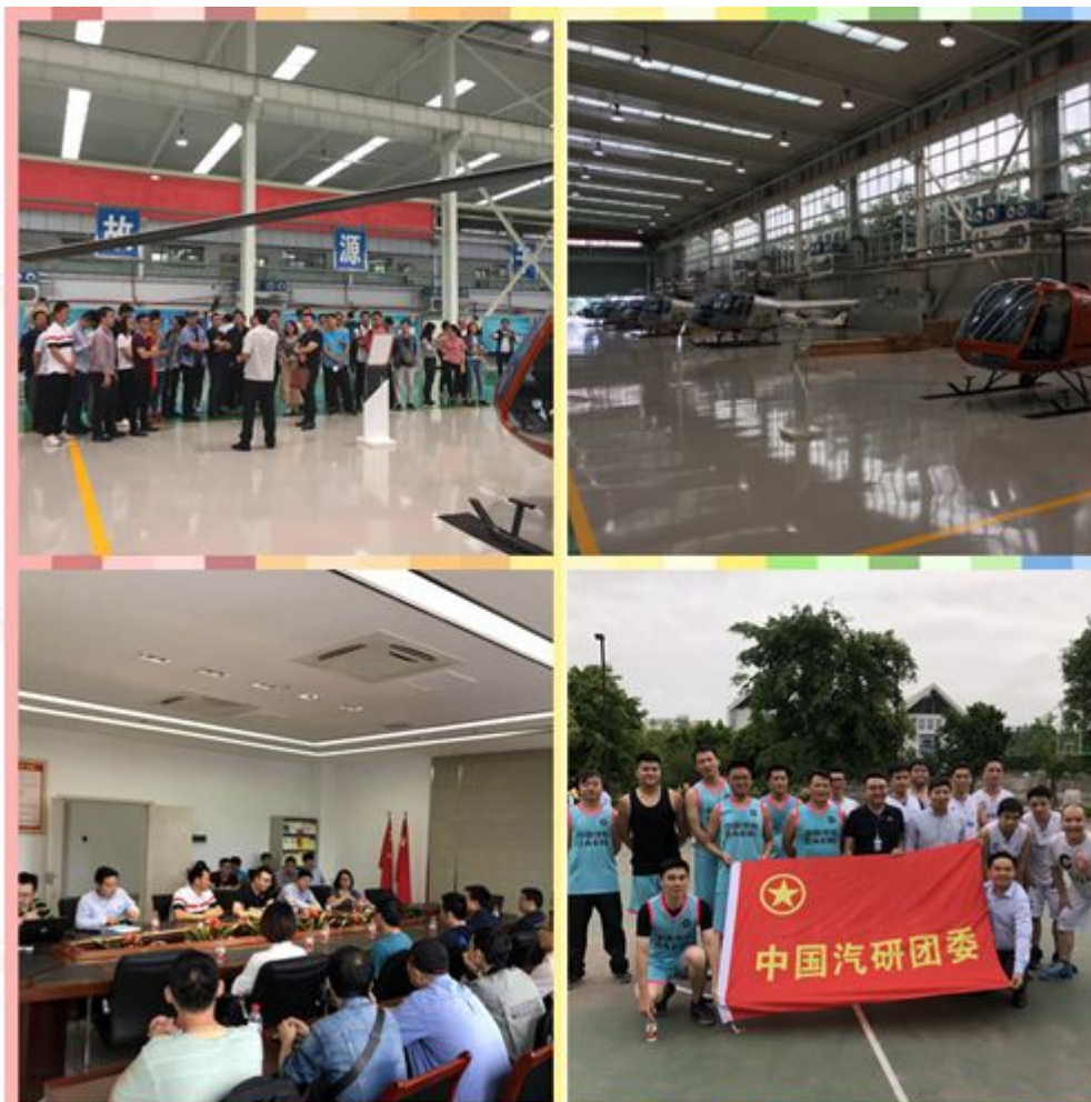
与重庆通航集团活动