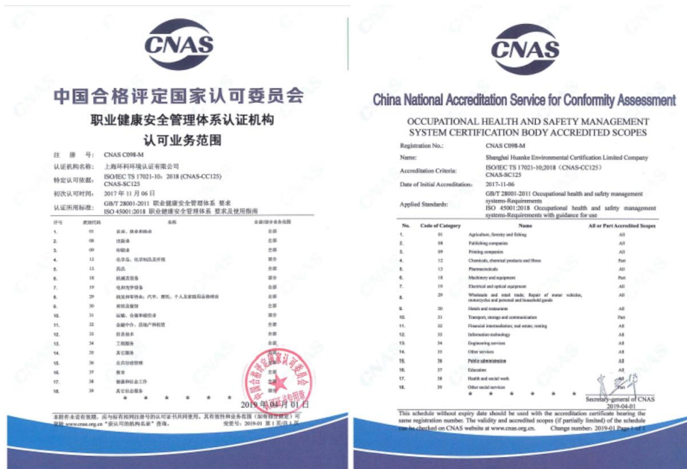
图 6 职业健康安全管理体系认可范围