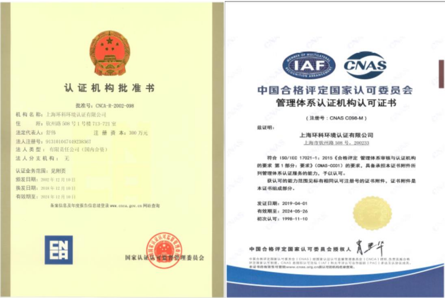
图 3 SEC 认证机构批准书、认可证书

2019 年环科公司在原认可业务范围基础上，顺利通过了 CNAS 的复评评审，取得新一轮的认可证书；与此同时顺利通过了 ISO45001:2018、ISO50001:2018 两大标准的转版评审。我机构的相关资质详见下图所示：