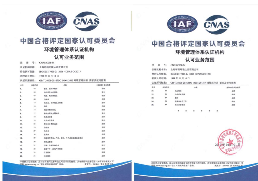
图 3 环境管理体系认可业务范围