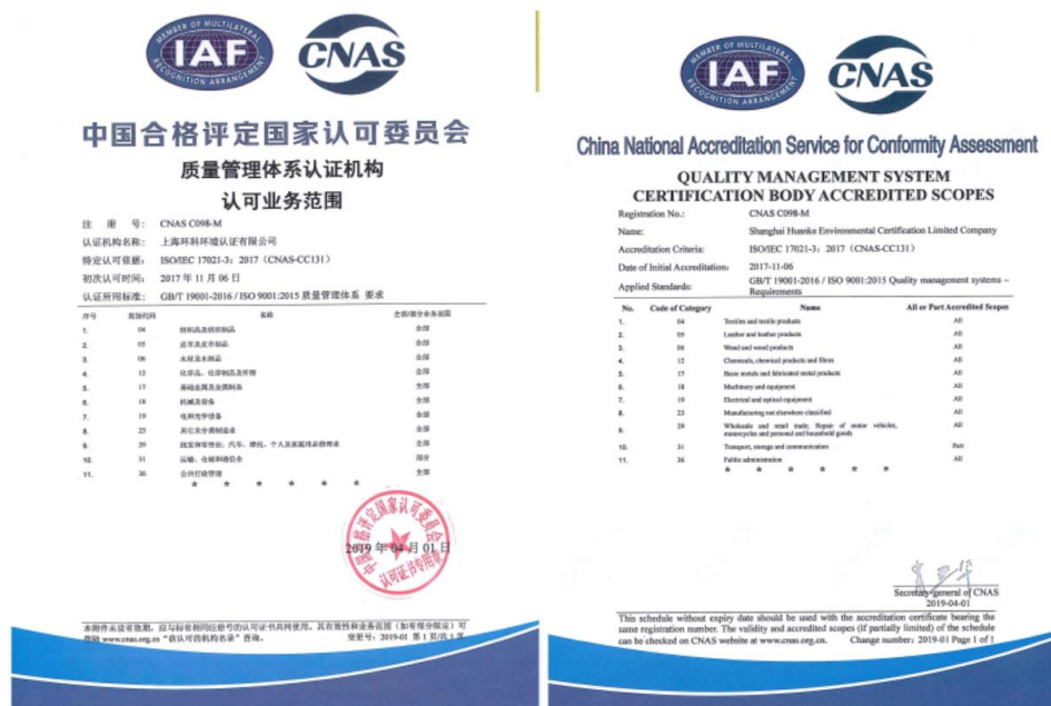
图 5 质量管理体系认可业务范围