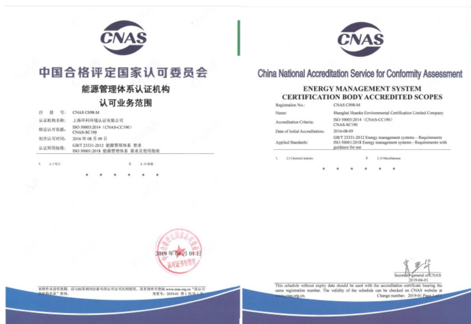
图 4 能源管理体系认可业务范围