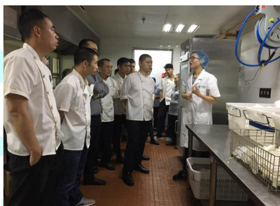
餐饮环节企业培训现场