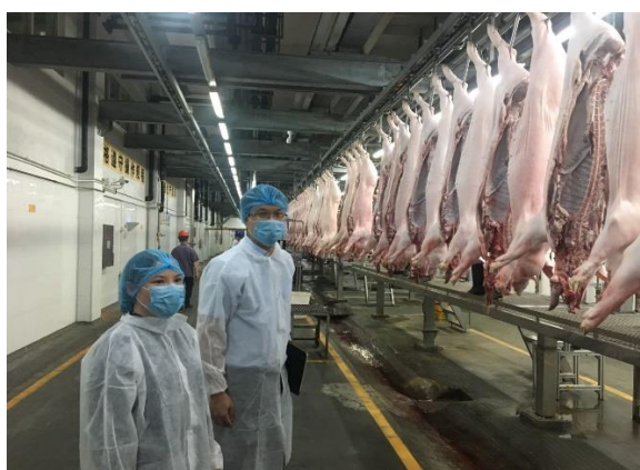
屠宰企业交流学习现场

格物正源始终以帮助客户提升在经营管理过程中的风险应对能力以获得更好的收益使命，鼓励员工积极参与各种形式的志愿者活动，培养和建立员工勇于担当的价值观，以实际行动回报社会。