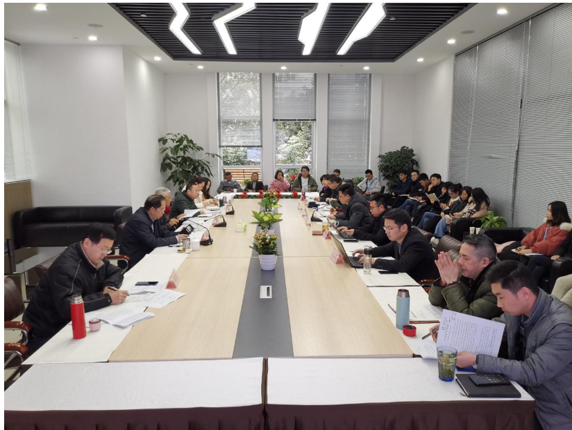
轨道交通质量基础座谈交流会