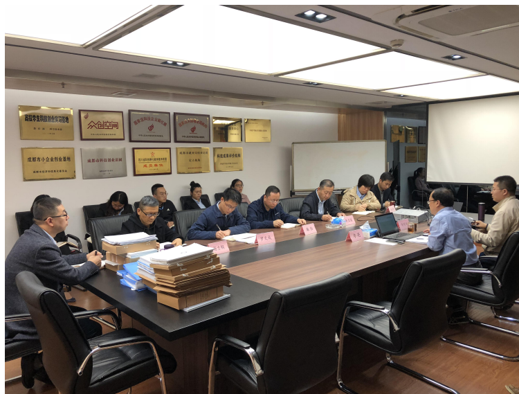
CNAS 专家组开展办公室评审

2019 年 10-12 月接受了国家合格评定认可委员会专家组的初审评审，分别对公司进行了文件评审、办公室评审、现场见证评审。此次评审共涵盖轨道交通 4 大领域，分别是车辆系统、牵引传动系统、列车控制与诊断系统、基于通信的列车运行控制系统（CBTC）。评审组通过座谈交流、查阅文件记录、现场见证等方式对公司体系实施运行情况进行了全面考评，其中办公室评审开出 4 个不符合项，见证项目开出 1 个不符合项，均已整改完毕并验证通过。