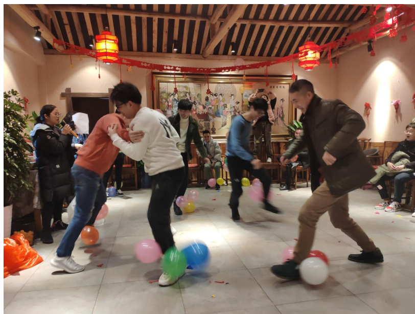
员工开展室内拓展活动

JRCC 始终秉持“人才文本、德才兼备、唯才是举”的企业人才观，为增强组织凝聚力、战斗力，进一步强化全员的团队意识和合作精神，释放工作压力，所有员工均有机会参与公司定期或不定期举行的各项活动，如：聚餐、户外拓展等，女职工享有三八妇女节聚餐及带薪休假。