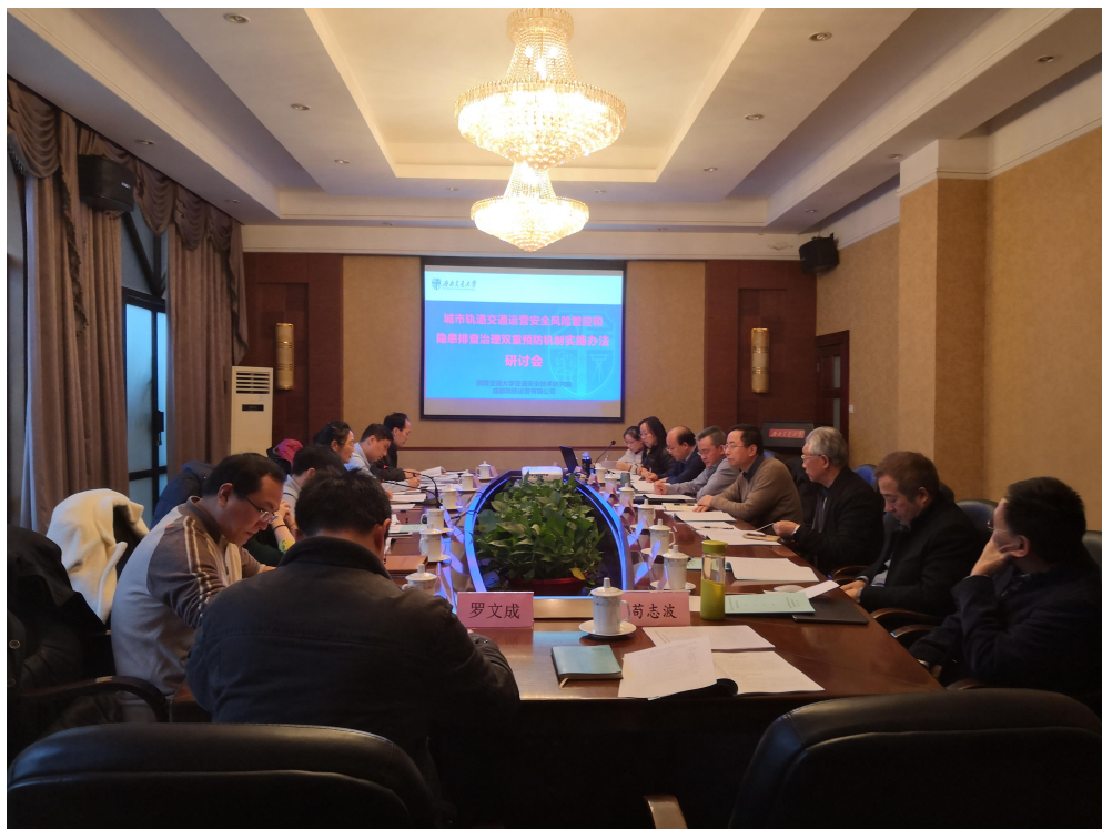
城市轨道交通运营安全风险分级管控和隐患排查治理管理办法研讨会

通过本次课题研究，JRCC 形成了丰富的安全风险分级管理及运营隐患排查治理经验，为开展城市轨道交通运营安全评估、产品认证、检测打下扎实的基础，极大的提高了 JRCC 城市轨道交通方向人员专业技术能力。