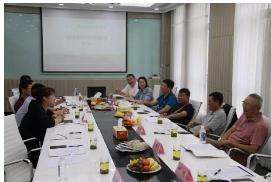
与会人员通正集团正厅合影留念