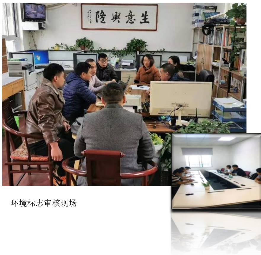
环境标志审核现场

2019 年，中标合信获得了中国环境标志产品认证和照明类节能、CCC 认证资质。这是中标合信践行保护广大消费者人身安全，促进社会可持续发展，节约能源、保护健康的庄严承诺。通过认证来保证企业产品的质量，低毒少害，节约资源，为政府采购把关，为贸易国际化护航。从而与企业一道为社会节约资源，保护环境一起努力。