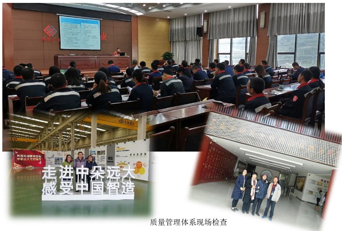
质量管理体系现场检查

高了企业客户满意度，提升了企业知名度，为推动企业国际贸易，提高产品质量的管控能力发挥了重要作用，这也间接的为推动社会经济可持续发展作出贡献。