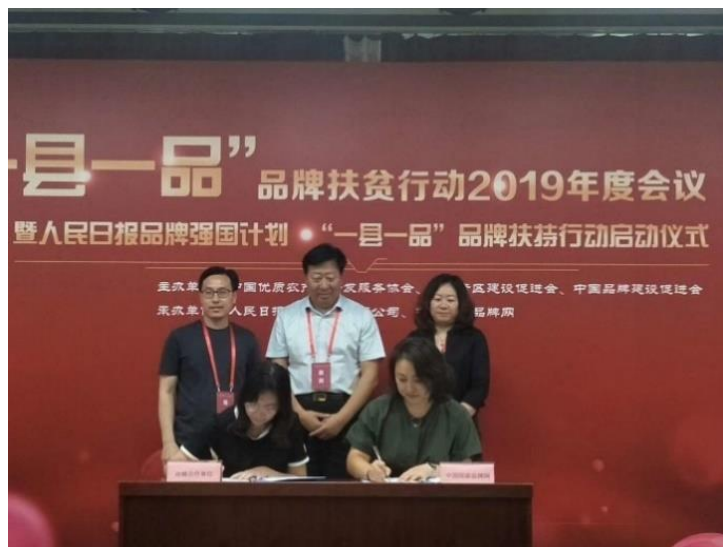
“一县一品”项目签约仪式

中标合信作为“一县一品”品牌扶贫行动标准和认证战略合作伙伴，将在农业领域的产业规划编制、标准化提升、区域公共品牌培育、国内外产品认证、管理体系认证与服务认证等一体化技术服务业务布局，助力“一县一品”扶贫行动，深入践行品牌扶贫、标准扶贫和认证扶贫，为打造品牌农业提供全方位标准和认证技术支持。共同致力于培育特色农产品区域品牌，推动农产品区域品牌健康、可持续发展。