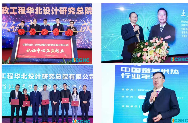
2019 中国燃气供热及商用燃气采暖炉产业联盟行业年会

2019 年 4 月，我中心主办 2019 年中国燃气供热及商用燃气采暖炉产业联盟行业年会。相关从业人员 350 余人出席此次大会。大会同期举行了中国市政工程华北设计研究总院有限公司认证中心成立仪式和首批自愿性认证证书颁发仪式。