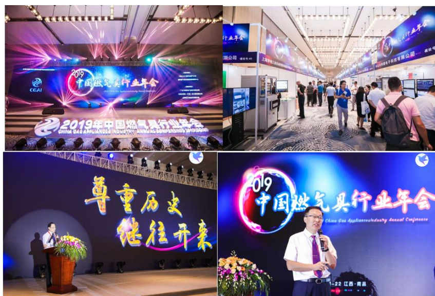
2019 年燃气具行业年会

2019 年 8 月召开燃气具行业年会，参加会议的代表有各类型的燃气用具生产企业，燃气具的零部件生产企业，燃气具的经销服务企业，检测仪器设备生产与经销企业，燃气具的检测机构，大专院校、科研单位以及技术服务机构，燃气行业的管理部门，行业媒体和公众媒体等 700 余人出席此次会议。我中心做了《家用燃气器具生产许可向强制认证转换有关情况介绍》专题报告，报告内容丰富、详实，引起与会人员强烈反响。