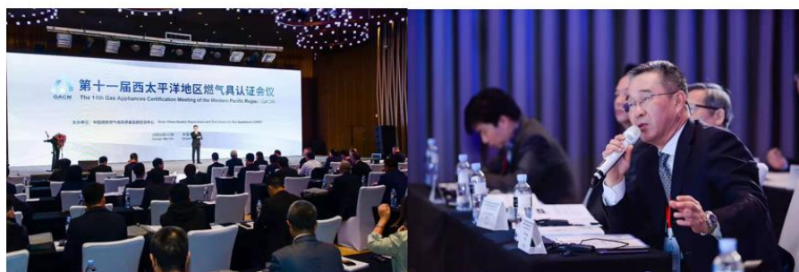
第十一届西太平洋地区燃气具认证会议