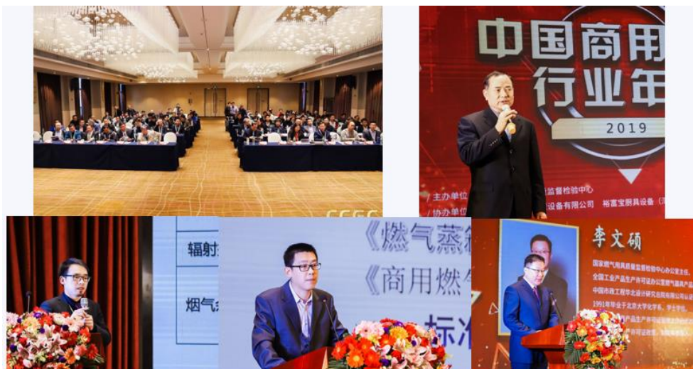
2019年中国商用燃具行业年会

2019年2月，我中心主办2019年中国商用燃具行业年会，100余人参加了会议，内容涉及标准、自愿性认证等内容。我中心做了《商用燃气具从生产许可证向产品认证的变革》专题报告，对商用燃气具产品认证工作和认证内容进行了详细的介绍。