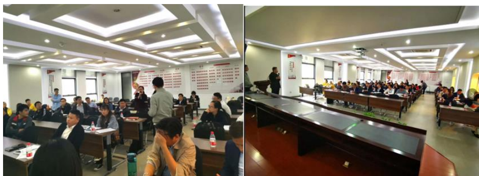
杭州老板电器交流会