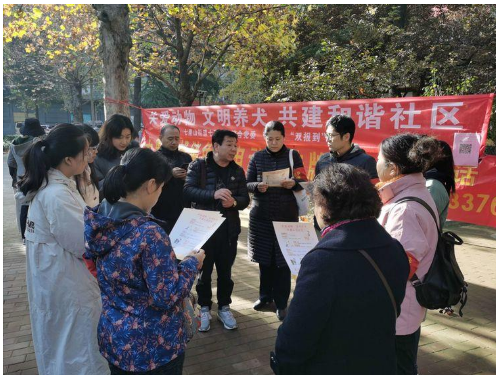
鲁源公司为社区居民讲解文明养狗知识