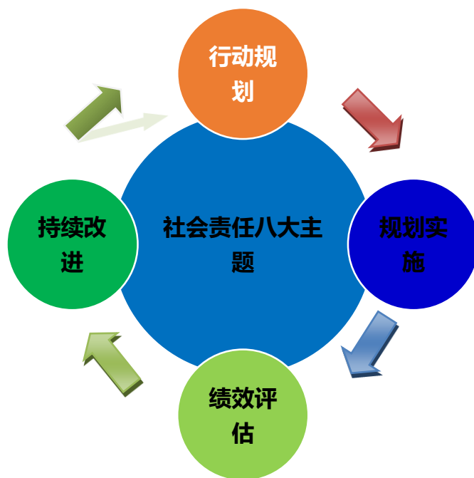
社会责任管理机制运行模式

在建立社会责任管理机制时，始终坚持遵守法律法规、规范运作、诚实守信、提升服务水平、创新发展、环保节能降耗、员工权益、服务社会的八大主题，运用成熟的 PDCA 循环模式，通过行动规划、规划实施、绩效评估及持续改进四个方面开展社会责任机制的建设和实施。