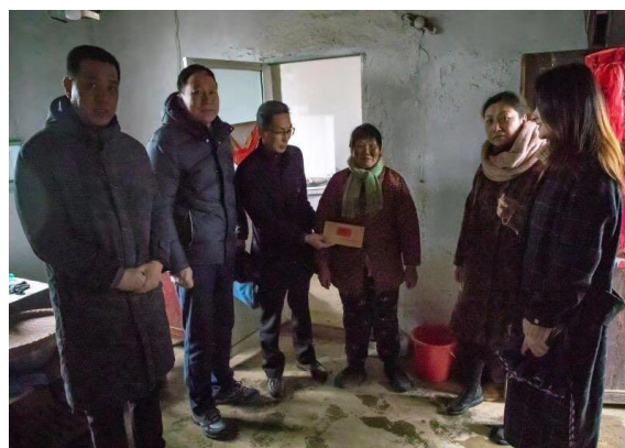
慰问金坛区茅东村困难村民