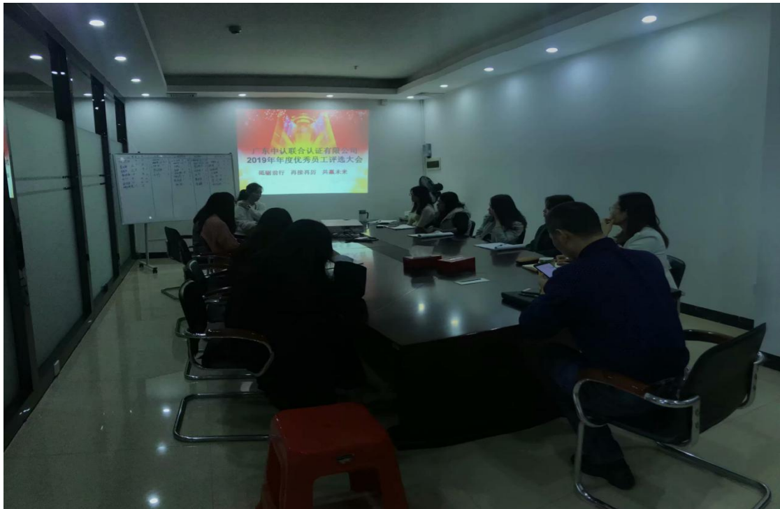
（2019年年终组织优秀员工评选大会，保证公平公正）