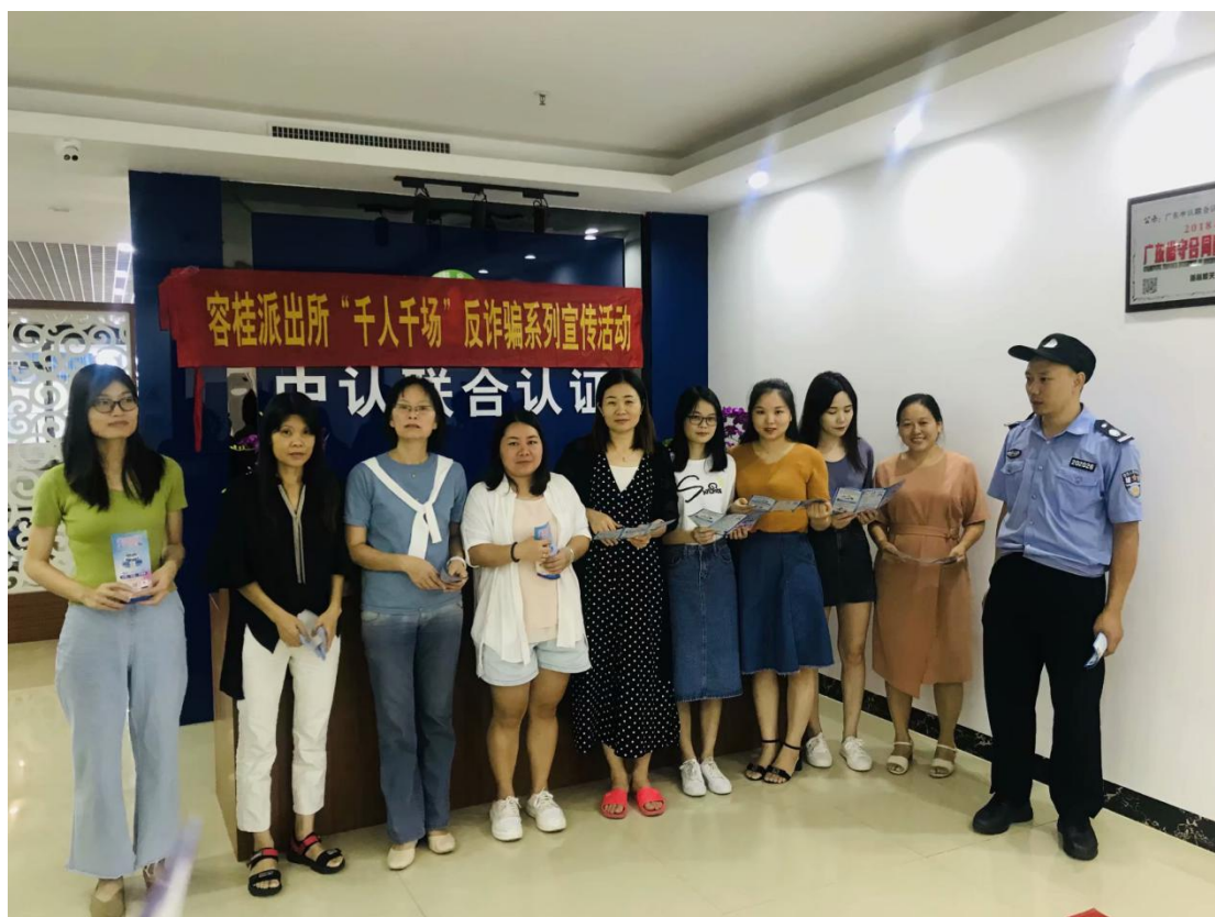
（2019年，参与街道派出所宣传活动）