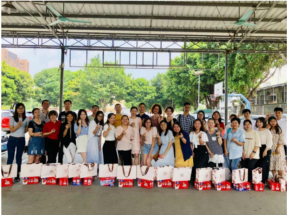
（2019年，中秋节公司组织员工聚餐）