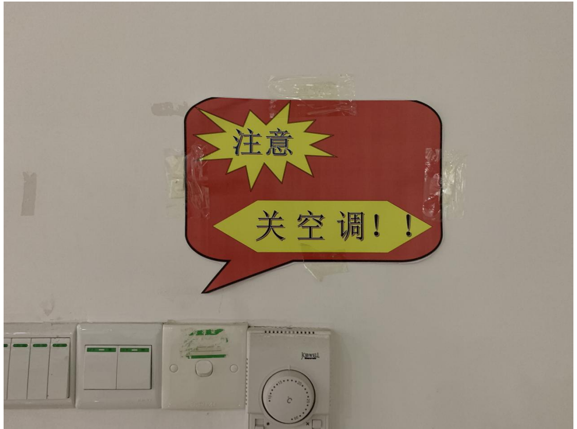
（公司内节约降耗标语一角）