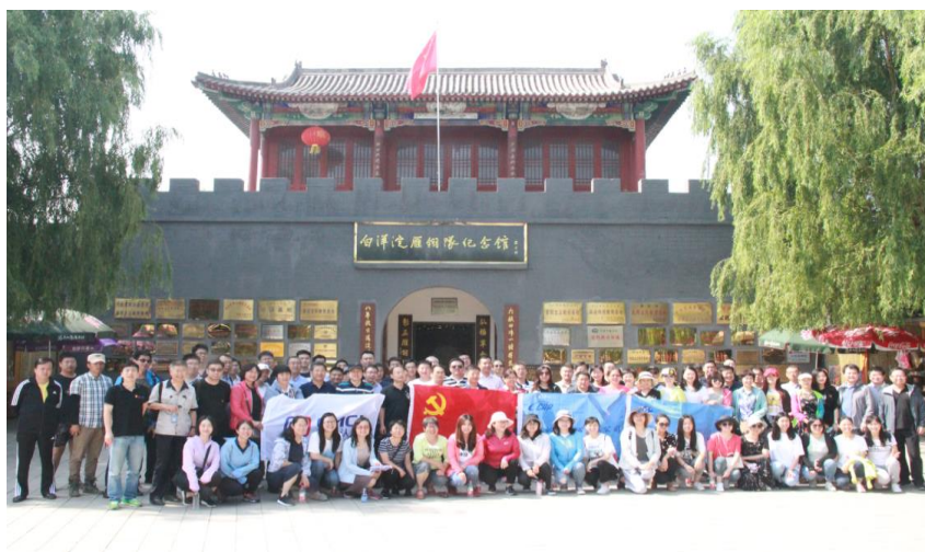
附图 7：主题教育活动