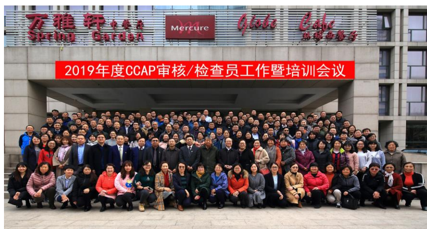
附图1：2019年度审核员/检查员工作会议