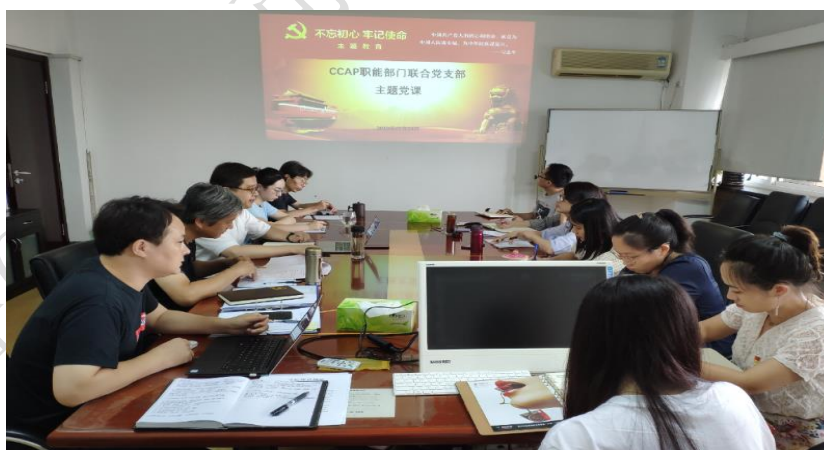
附图11 支部党员大会

（2）以规范“两个一以贯之”公司治理机制为重点，建立完善党内重要制度。认真落实党总支“把方向、管大局、保落实”总要求，努力提高“三重一大”事项前置研究质量，建立健全法人治理结构议事