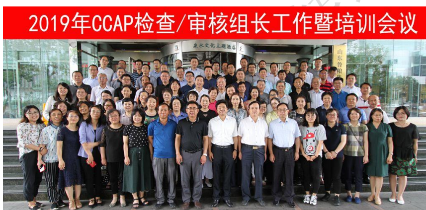
附图2：2019年度审核/检查组组长工作会议