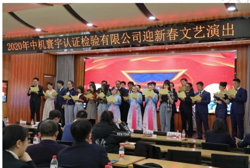
附图 8：春节文艺联欢会