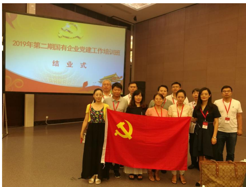
附图10 支部书记集中轮训

（1）以突出政治和思想建设为重点，认真学习贯彻习近平新时代中国特色社会主义思想 and 党的十九大精神，组织开展“不忘初心，牢记使命”系列教育实践活动。