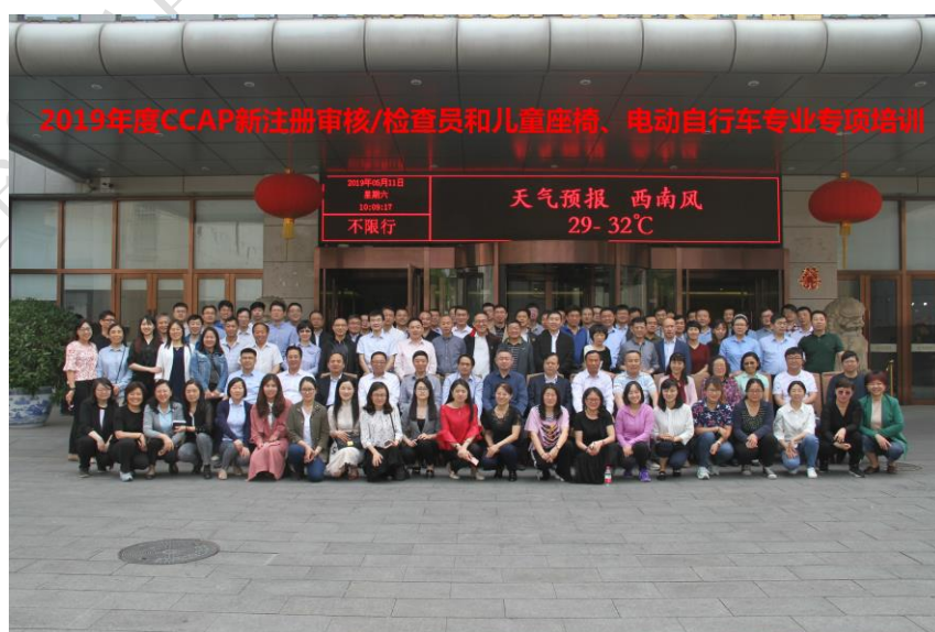
附图3：2019年度新注册审核/检查员及专业检查员工作会议