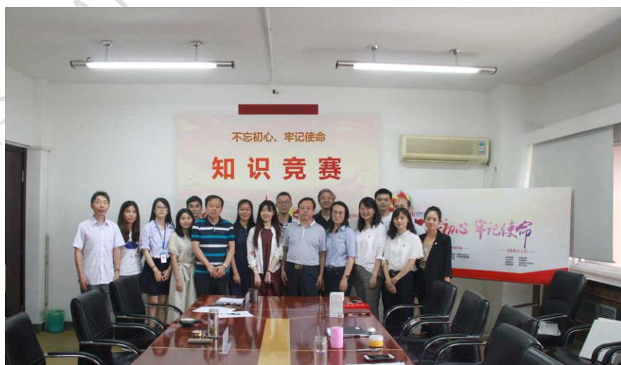
附图 9：党史知识竞赛