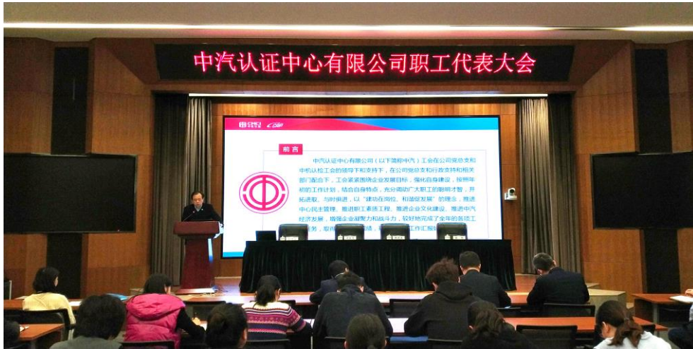
附图 5：职工代表大会

(4) 积极关爱职工健康。2019 年工会坚持重病住院探望、慰问制度，在元旦、春节等重要节日开展送温暖活动，对生病和困难职工及时慰问，累计对 4 名困难职工发放慰问金 8000 元。