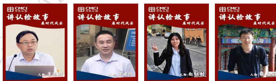
附图 12 先进典型人物报道

(6) 成立宣传工作小组，建立中汽认证 OA 宣传稿件审批流程，2019 年在中机认检品牌栏目“认检故事”报道中汽认证先进典型人物 4 人次，在官网、官微等媒体平台完成机构重要事件宣传 83 篇次，有效强化品牌建设，提升机构形象。