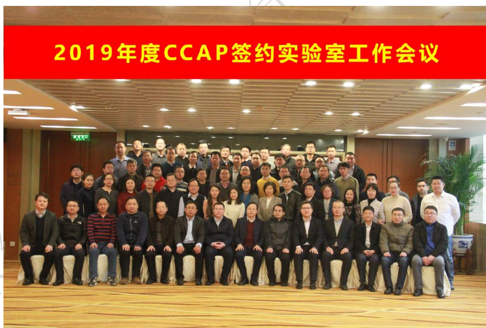
附图4：2019年度签约实验室工作会议

(2) 完善签约实验室动态管理。 根据认证业务范围变化，2019 年中汽认证对签约实验室和自有检测资源进行动态监管，除按照年度工作计划完成签约实验室年度监督评价、企业自有检测资源利用资格评审及 8 家实验室业务和信息更新外，完成新增电动自行车、制动器衬片、T-BOX 等产品 4 家新实验室的签约工作。2019 年 12 月 20 日在北京成功举办签约实验室年会，40 余家实验室主要负责人参会。会上，中汽认证高层领导针对强制性产品认证政策改革动向和中汽认证实验室管理要求向各签约实验室进行了宣贯。同时，会上中汽认证有关负责人通报了 2019 年机构落实认证机构主体责任情况及 CCC 指定实验室专项检查情况。此外，中汽认证与签约实验室就一年来工作情况及未来合作意向进行密切沟通，有效确保签约实验室的规范管理。