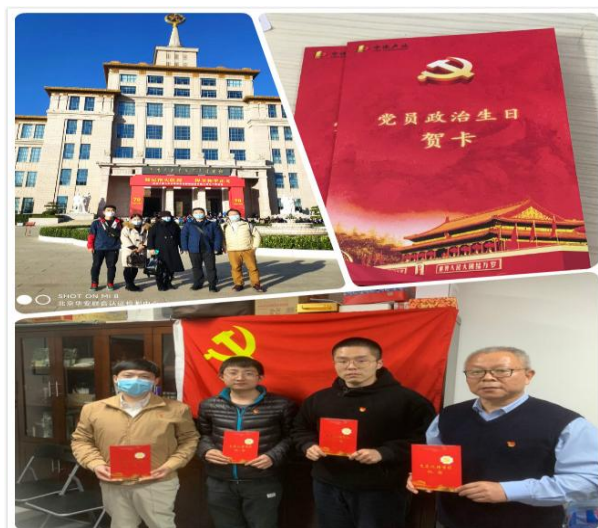
党员政治生日及抗美援朝70周年展览

2020年11月组织员工参观抗美援朝七十周年展览，增强爱国爱党的自豪感，坚定理想信念，提高党性觉悟，领会新时代中国特色社会主义建设过程中共产党员乐于奉献、勇于担