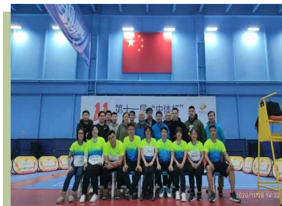
“中体杯”羽毛球比赛

同时中心工会积极响应总局和集团的号召，深入贯彻中央扶贫开发工作会议精神，切实增强责任感、使命感、紧迫感，坚持精准扶贫、精准脱贫。