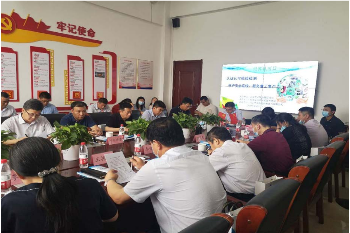
2020 年 6 月 9 日世界认可日宣传活动