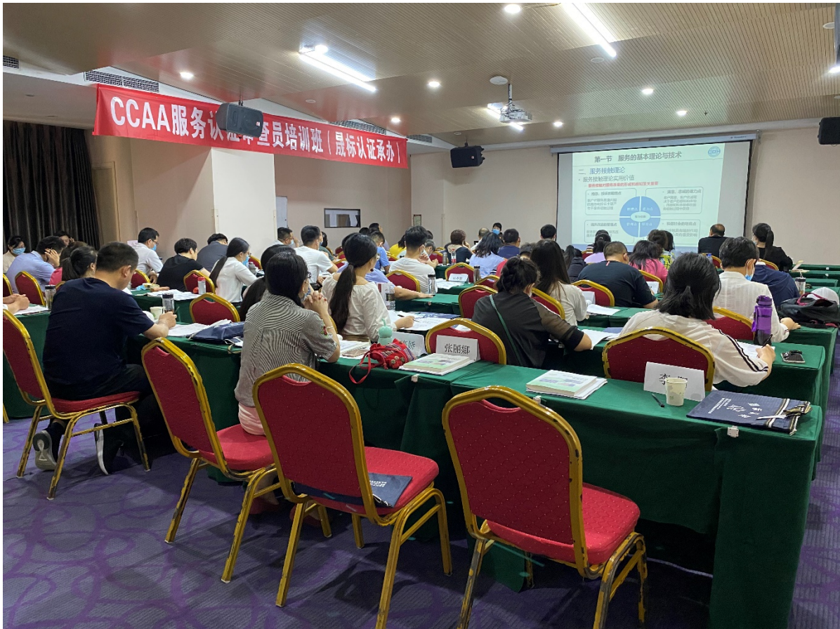
晟标第二期服务认证注册审查员培训班