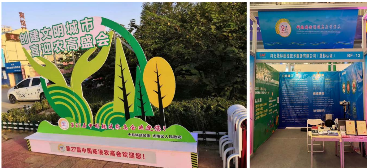
10月22-26日第二十七届中国杨凌农高会