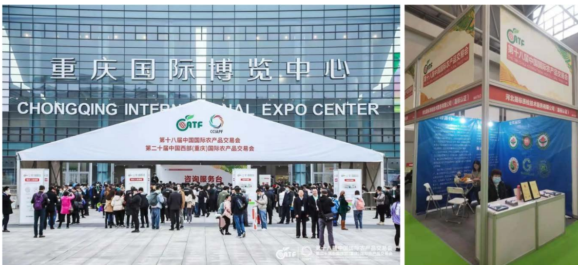
11月27-30日第十八届中国国际农产品交易会

改善环境问题已经日益成为社会发展的重中之重，有机产品生产本身就是注重协调和保护生态环境的一种生产方式，作为有机产品认证机构，树立“铺张浪费为耻，节约勤俭为荣”的科学发展观；充分利用专业认证人员的经验、技能、节能减排的理念，积极在认证服务过程中宣扬尊重自然、顺应自然、保护自然的有机理念，在监督和服务过程中积极倡导企业在有机生产中更多的关注自然保护问题，引导有机产品生产企业树立“只有积极主动的保护自然才是可持续发展有机农业生产的重要保障”的经营意识。同时，我们在机构内部的日常工作中，也积极倡