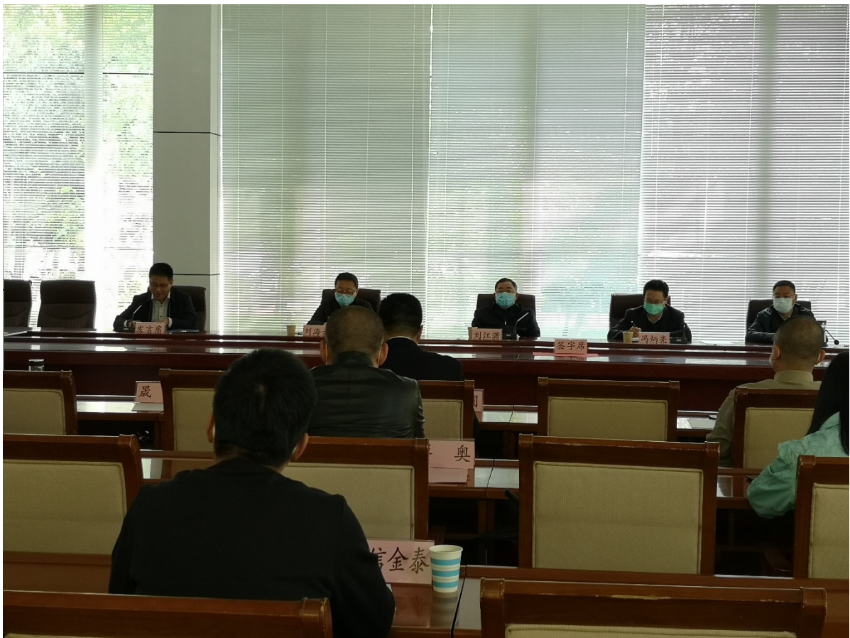
2020 年 4 月 26 日防疫用品领域认证活动专项整治行动推进会