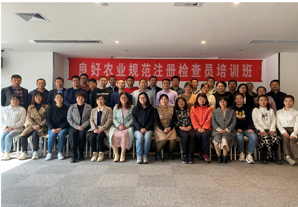
2020 年 10 月 17 日-19 日第四期良好农业规范注册检查员培训班