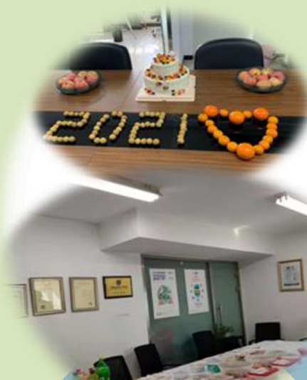
庆祝节假日（疫情期间办公室小聚）