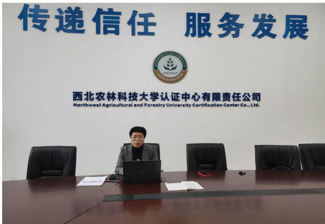
2020 年杨凌体系云培训