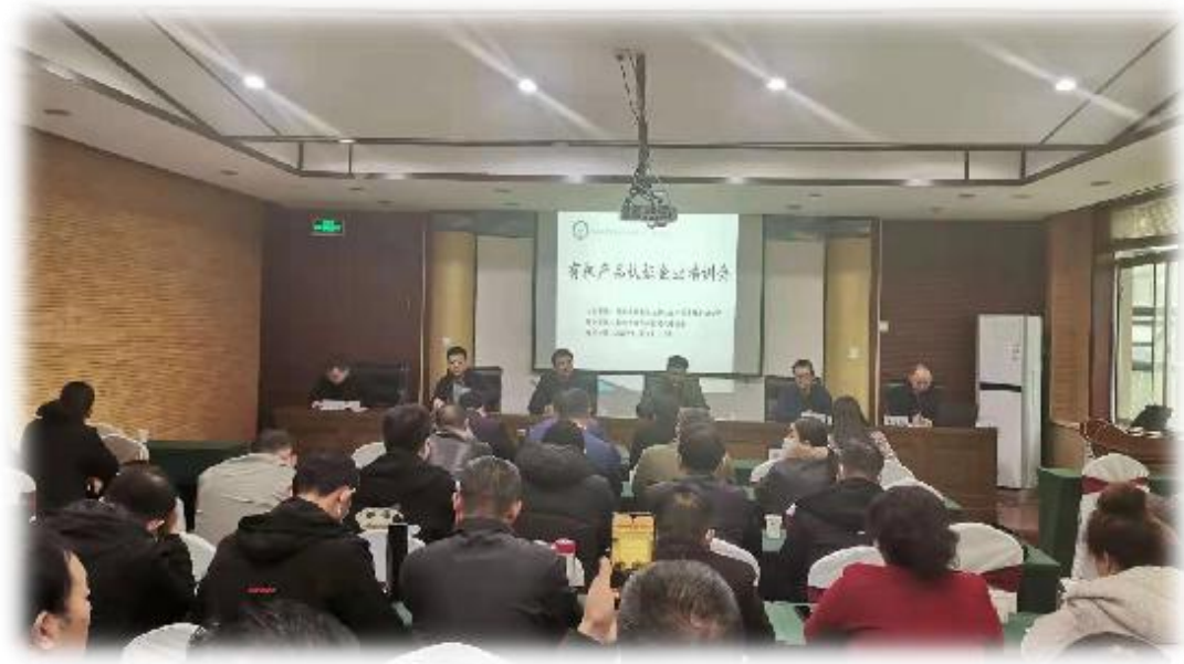
西山有机认证产业发展专题培训

县、陕南贫困山区，以及其他未出列贫困县、村的有机认证企业，持续减免有机认证费用。对于因自然灾害等原因，受到大量损失的有机认证企业实行认证费用减免办法。本年度为 20 多个企业减免约 12.05 万元的认证费用。支持宝鸡市西部山区建设委员会扶贫产业工作，承办西山有机认证产业发展专题培训。