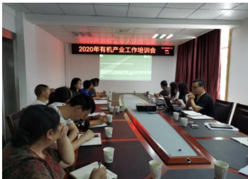
2020 年四川宝兴技术培训