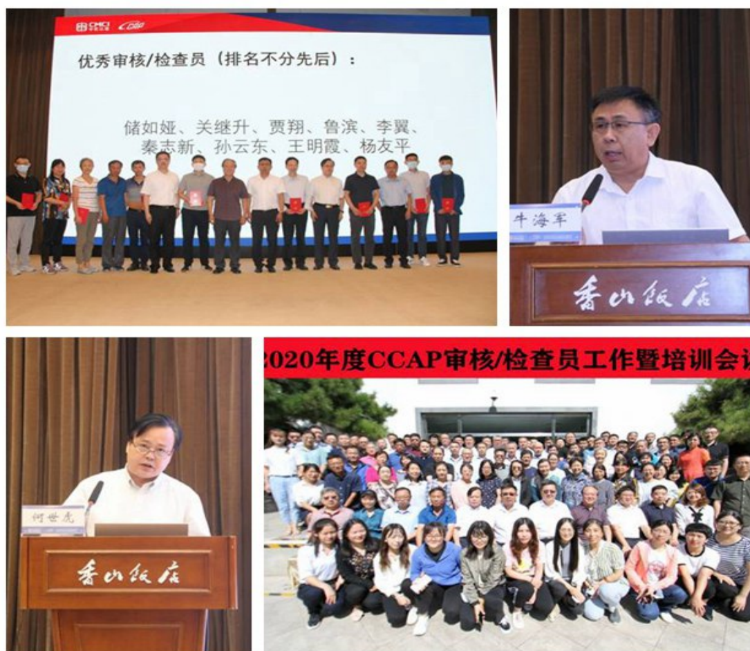
附图1：2020年度审核员/检查员工作会议

业意识，筑牢底线思维防线，并通过随机电话回访企业等方式进行监督，确保认证审核公正性及专业性，维护认证工作及认证机构权威性。对于审核/检查员提交的认证档案中存在质量问题的，严格按照《审核/检查员正面激励负面约束管理办法》进行处罚，切实提高审核/检查员质量责任意识，有效强化机构认证风险防控水平。此外，结合公司实际业务需要，科学合理聘用业务能力强、专业素养高的审核/检查员，着力培养稳定的中坚力量，打造一支高质量的审核/检查员队伍。