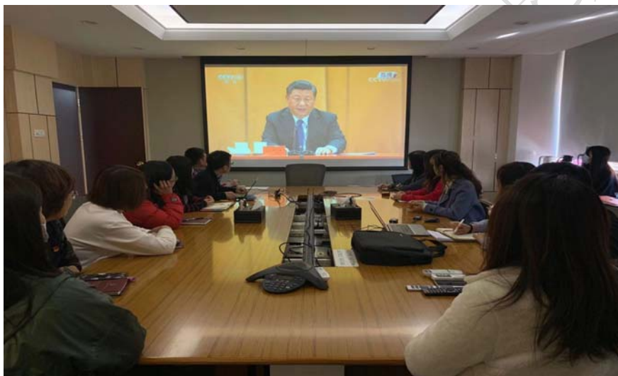
附图4 习主席抗美援朝出战70周年大会学习