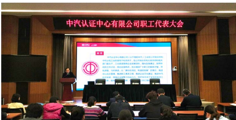
附图 2：职工代表大会

（5）积极关爱员工，解决员工实际困难。 通过总经理接待日、青年员工座谈会、老专家经验交流会等多种渠道了解关心员工实际诉求，解决部分员工实际困难（员工重病住院探望慰问制度、元旦春节送温暖活动、困难党员和职工发放慰问补贴、单身员工住宿难题、疫情期间停车难、物资紧缺问题）。组织开展读书会、员工素质拓展、乒乓球赛等文体活动，丰富员工文化生活，促进企业文化提升。薪酬科学合理分配，收入持续稳定增长，员工获得感、幸福感增强。