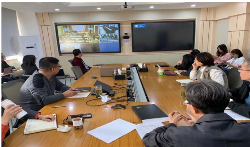
附图3 集中党课培训